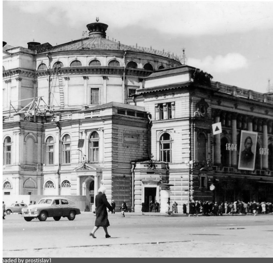
oaded by prostislav1