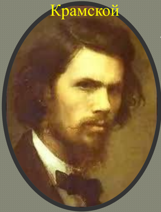
Иван Николаевич Крамской

Крамской боролся против так называемого «чистого искусства». Он призывал художника быть человеком и гражданином, своим творчеством бороться за высокие общественные идеалы.