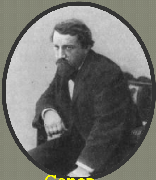
Серов Валентин Александрович