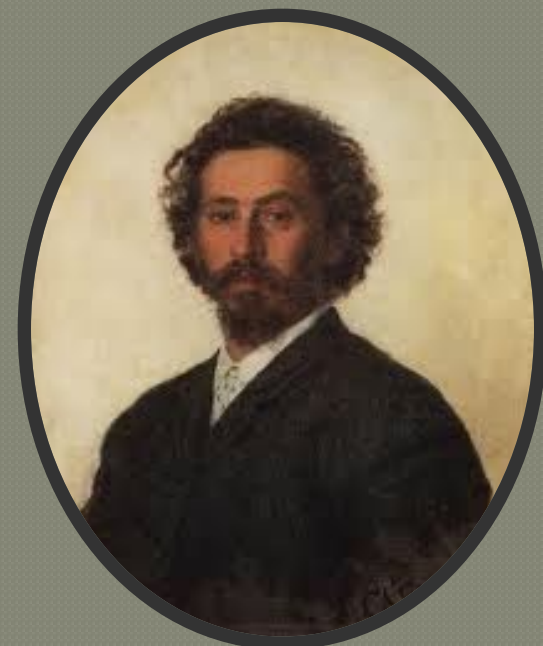
Илья Ефимович Репин