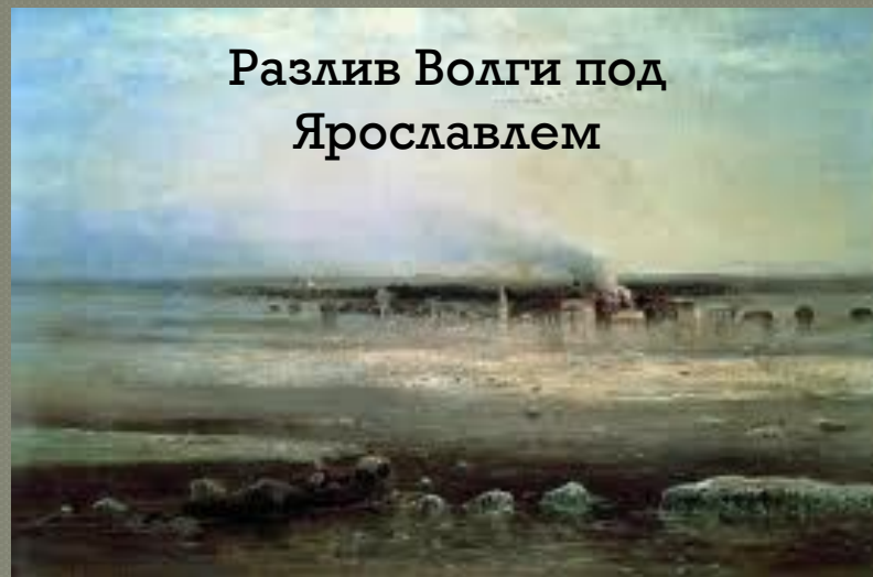
Разлив Волги под Ярославлем