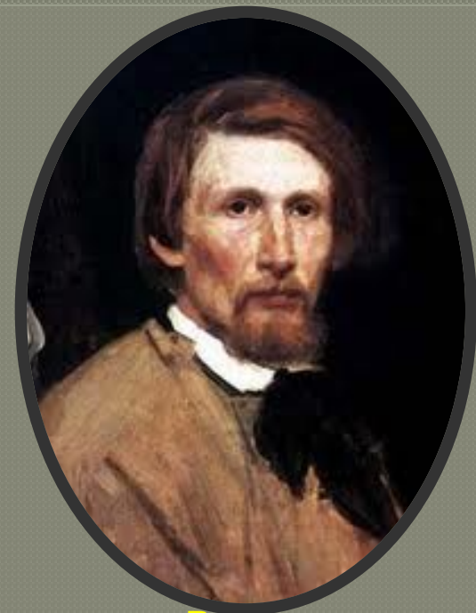
Виктор Михайлович Васнецов