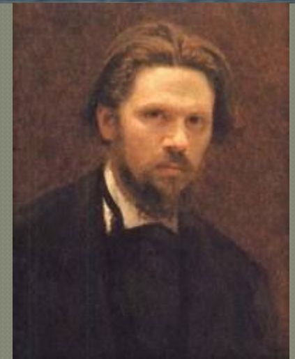
Иван Николаевич Крамской

9 ноября 1863 г. большая группа выпускников Академии художеств отказалась писать конкурсные работы на предложенную тему из скандинавской мифологии и покинула Академию.