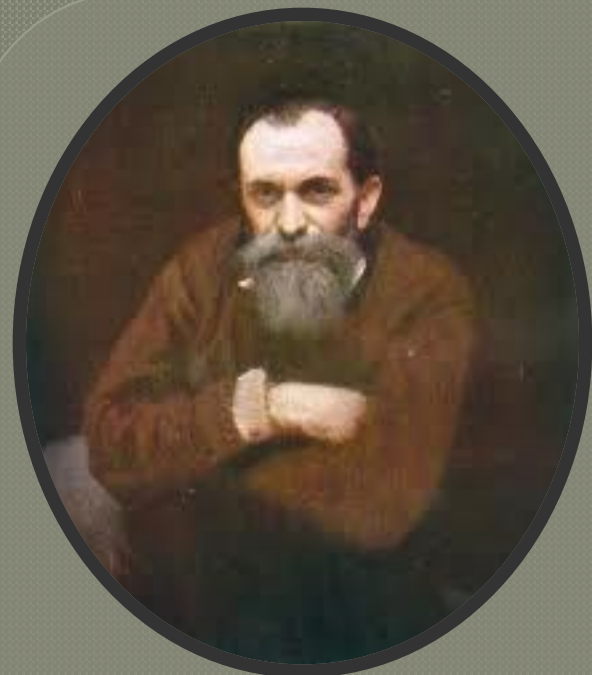
Василий Григорьевич Перов