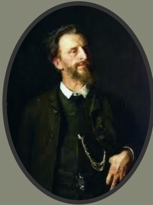
Г. Г. Мясоедов