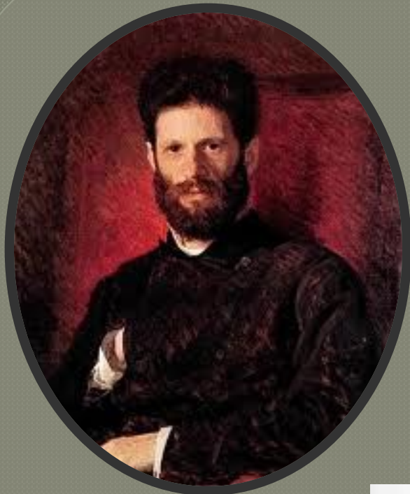
Марк Матвеевич Антокольский