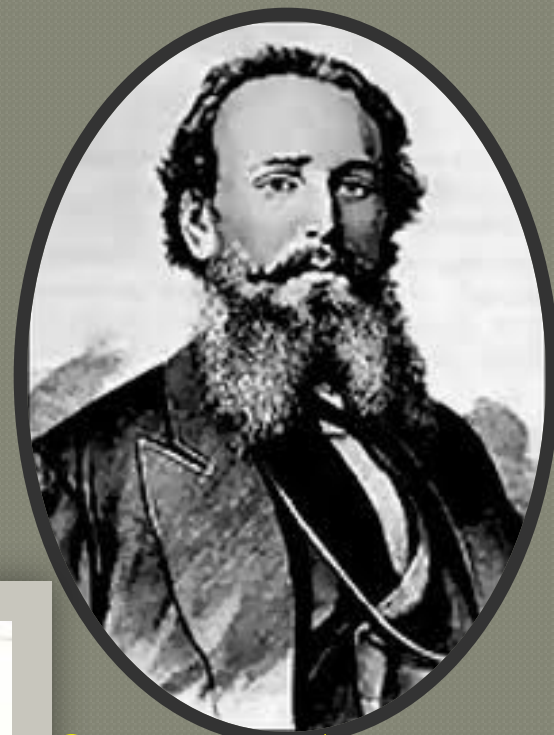
Опекушин Александр Михайлович.