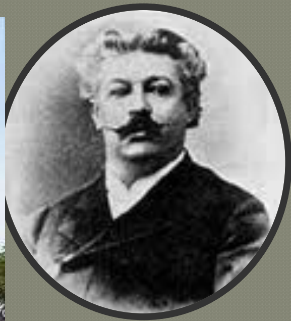
Михаил Осипович Микешин