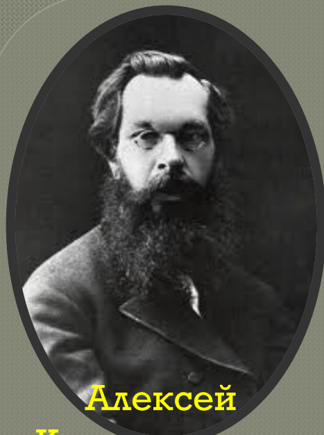
Алексей Кондратьевич Саврасов