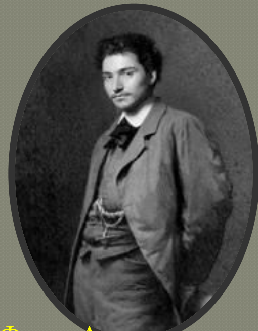
Федор Александрович Васильев