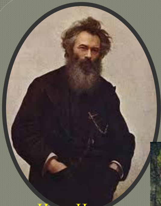
Иван Иванович Шишкин