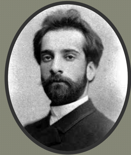
Исаак Ильич Левитан

К концу XIX в. влияние передвижников упало. В изобразительном искусстве появились новые направления.