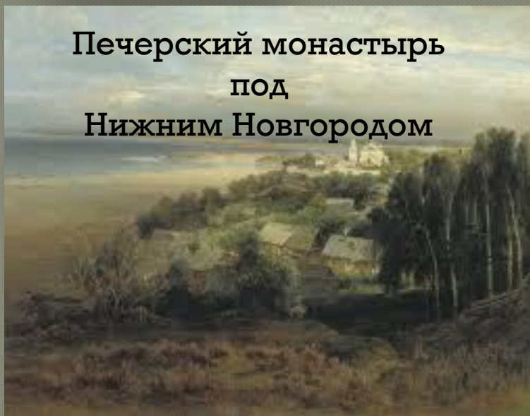
Печерский монастырь под Нижним Новгородом

«...все это деревья, вода и даже воздух, а душа есть только в «Грачах...».