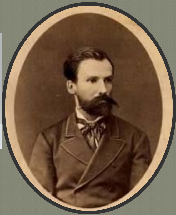
Лансере Евгений Александрович