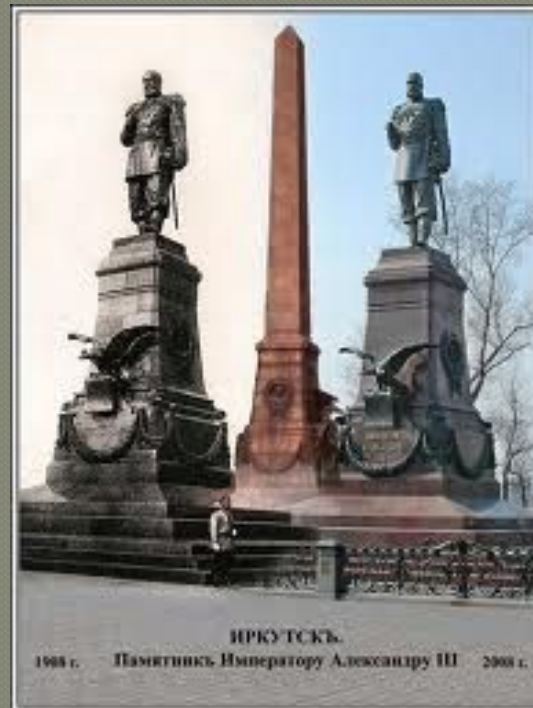
ИРКУТСКЪ. 1908 г. — Памятникъ Императору Александру III — 2008 г.