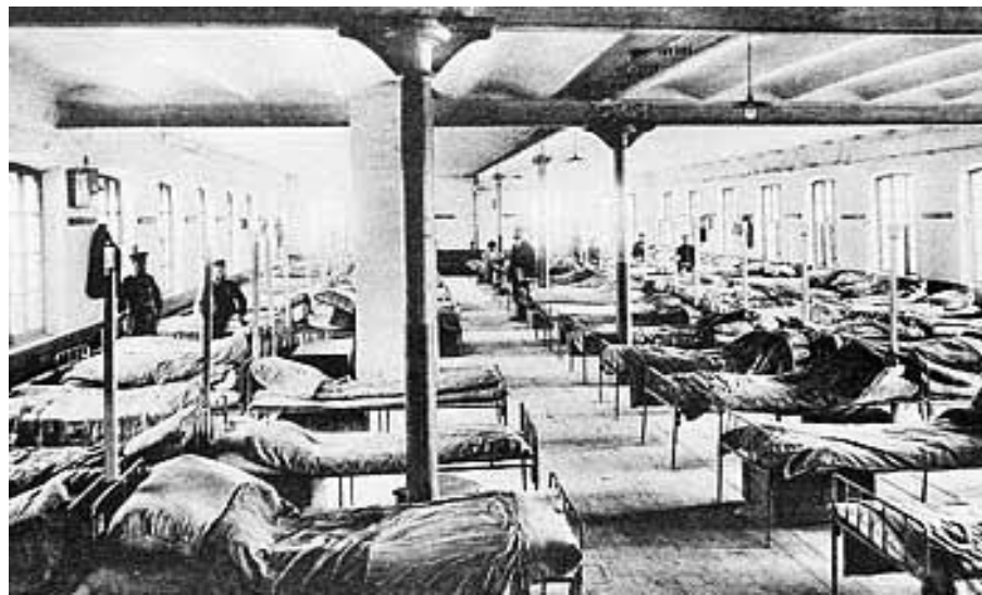
Внутренний вид казармы для фабричных рабочих