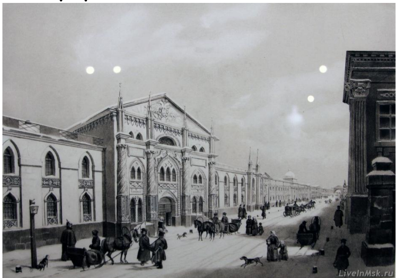
Москва. Никольская улица