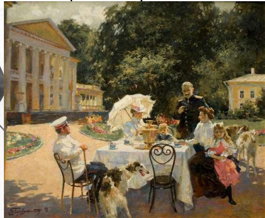
В. Первуинский. В усадьбе

Рацион русской знати в середине XIX в. насчитывал более 300 различных блюд и напитков, в том числе блюд иностранных кухонь.