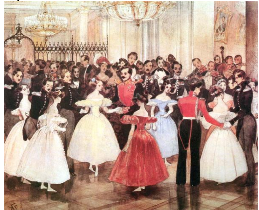
Г. Г. Гагарин. Бал у княгини М. Ф. Барятинской