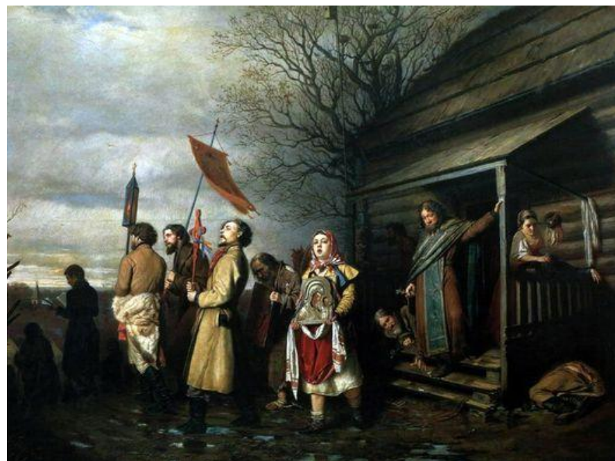
В. Перов. Сельский крестный ход на Пасхе