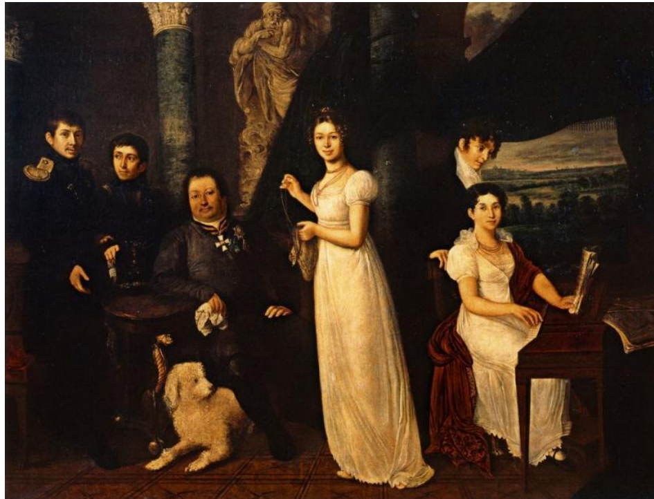
В. А. Тропинин. Семейный портрет графов Морковых