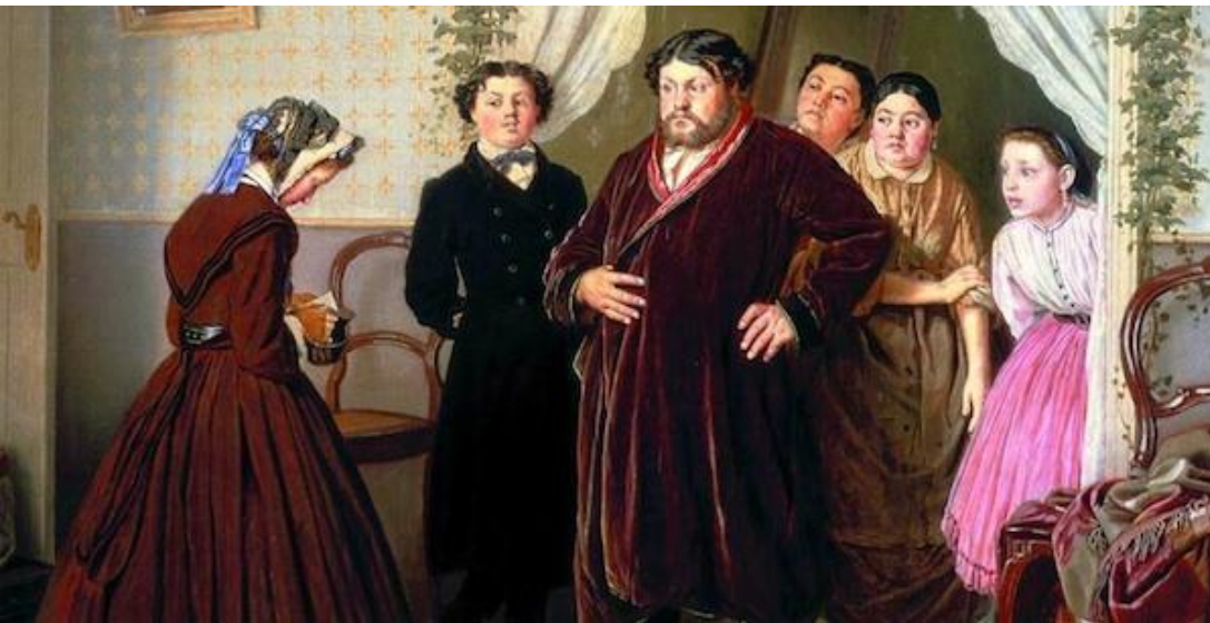
В. Г. Перов. Приезд гувернантки в купеческий дом