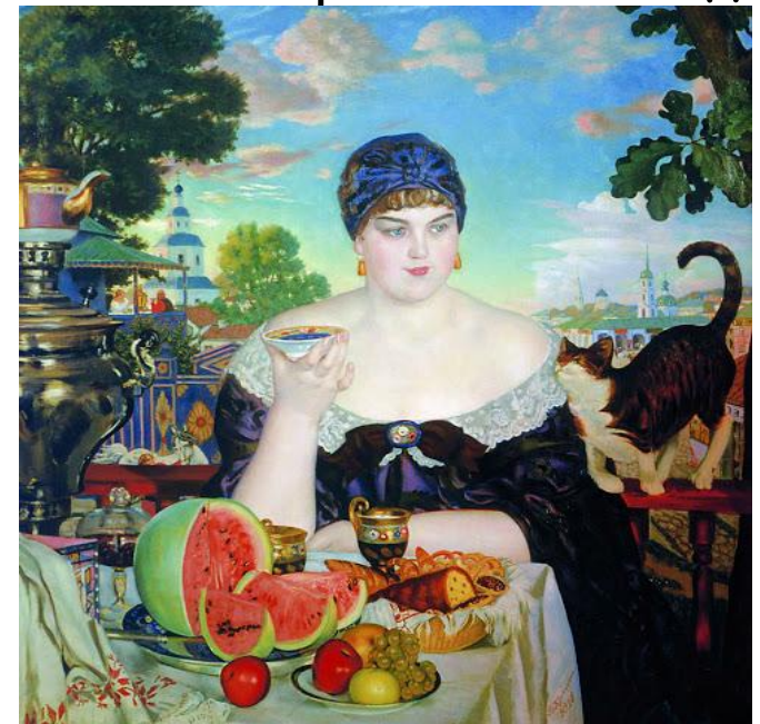
Б. М. Кустодиев. Купчиха за чаем