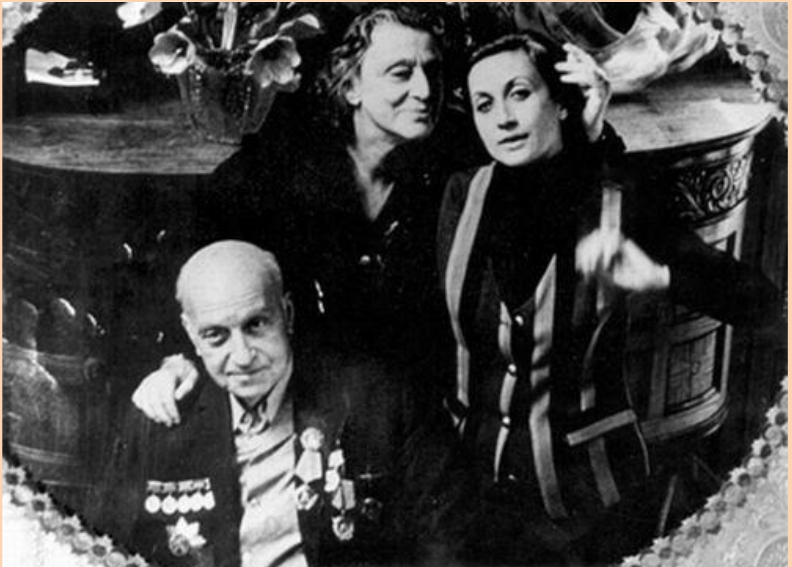
М. Чиаурели с женой и дочерью