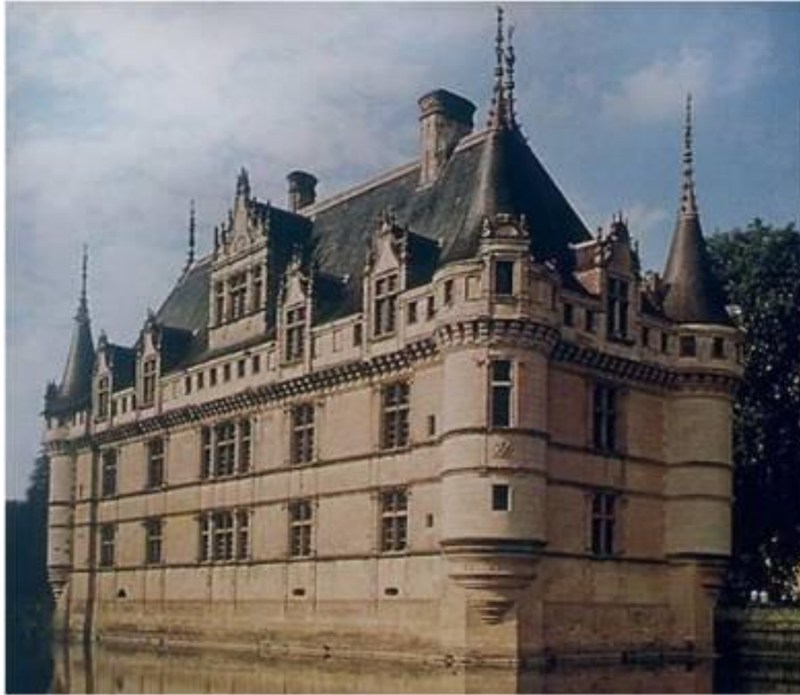
Замок Азе-ле-Ридо в 16 в. Франция

Замок - укреплённое жилище феодала в средневековой Европе.