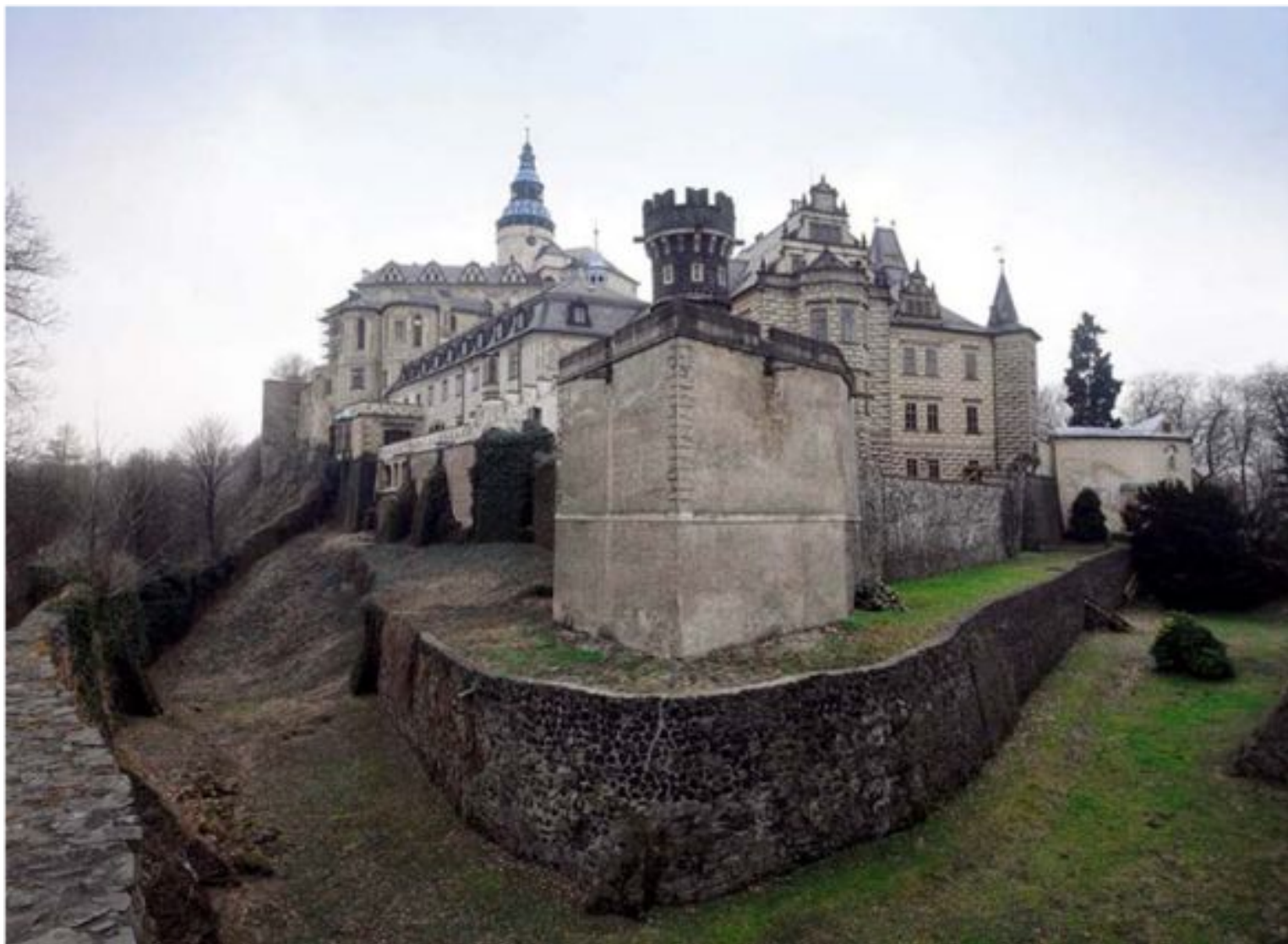
Замок Фридлант. Чехия