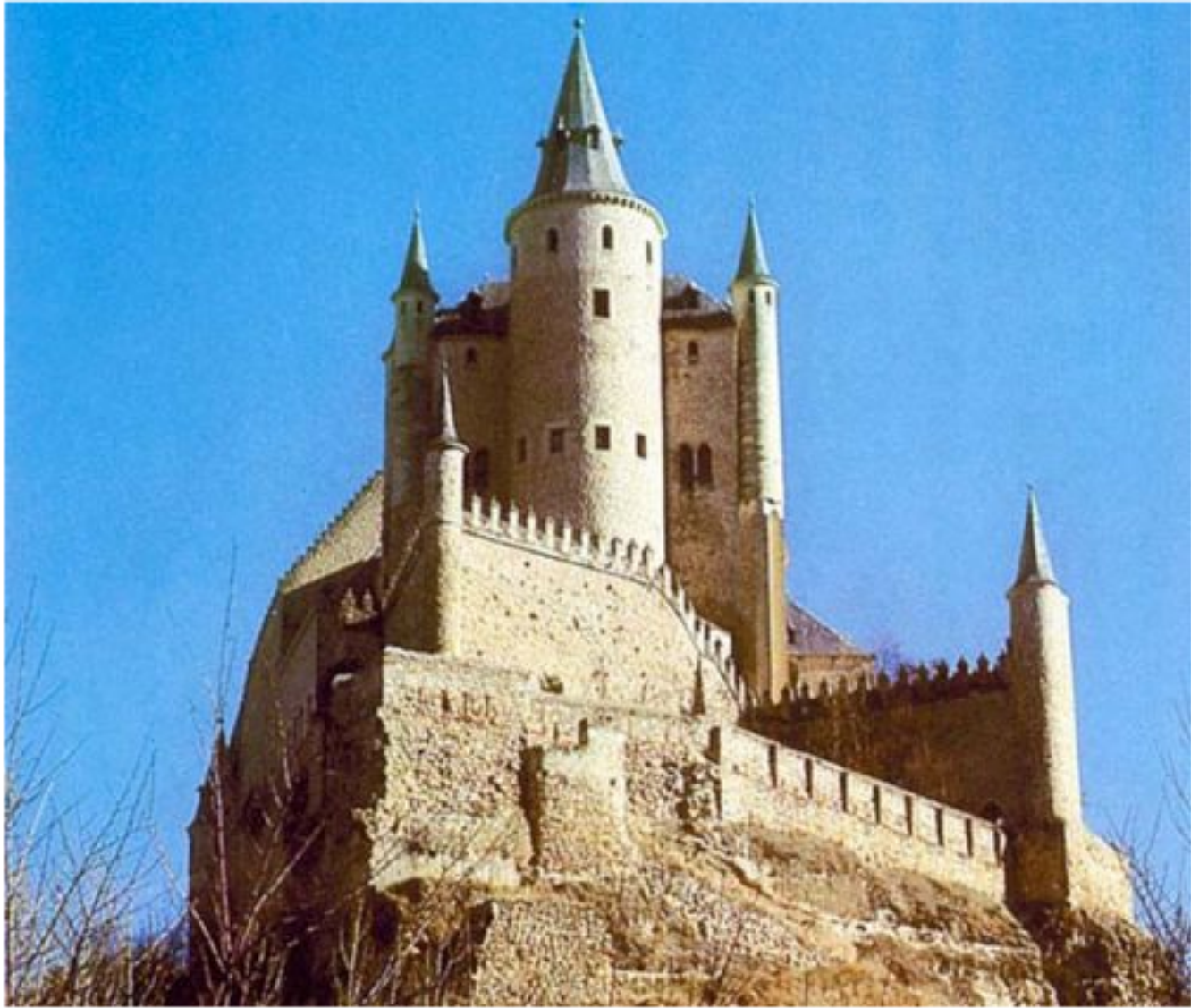
Замок Алькасар. Испания. 1110 – 1140 г