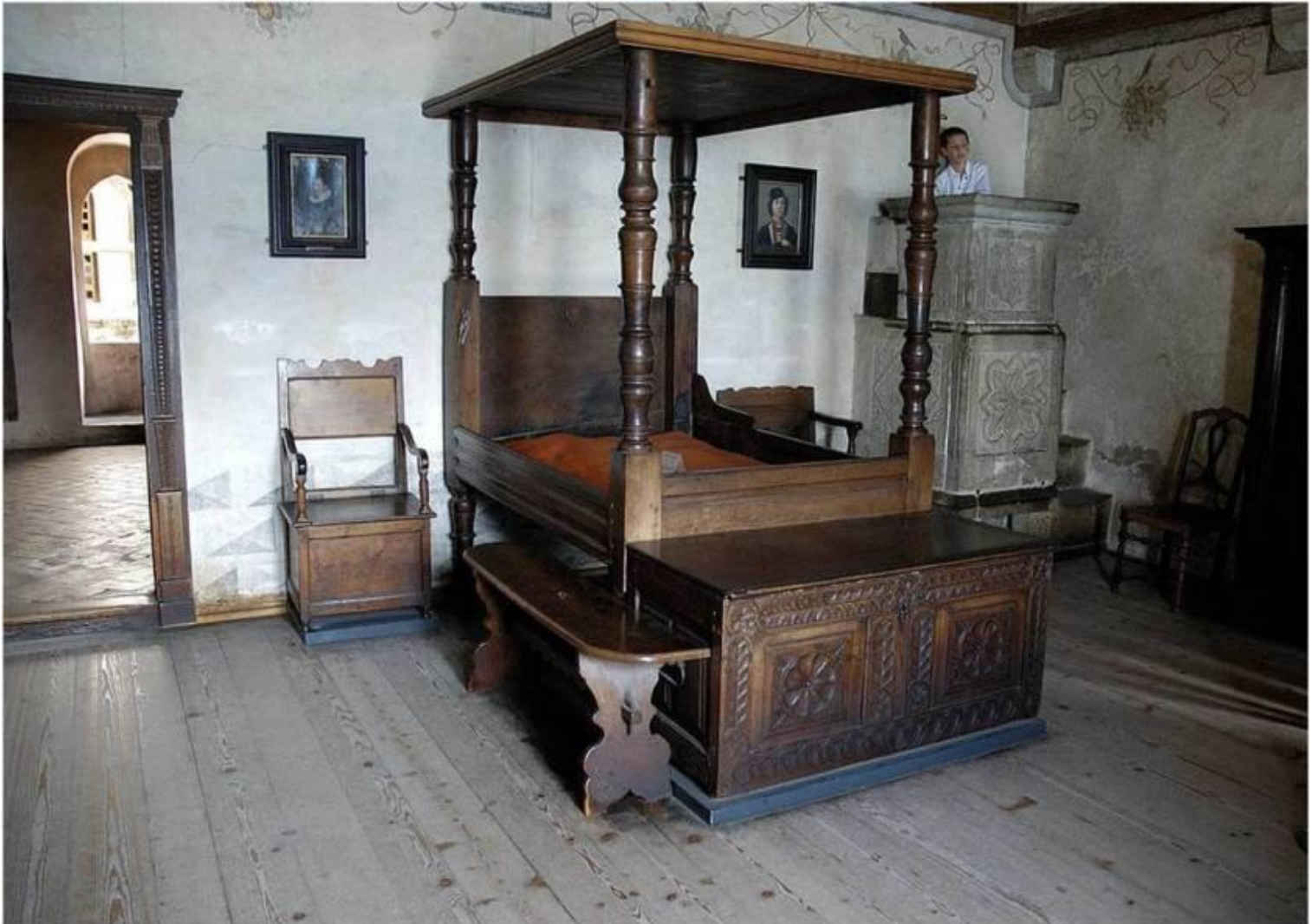
Спальня хозяев замка. Реконструкция.