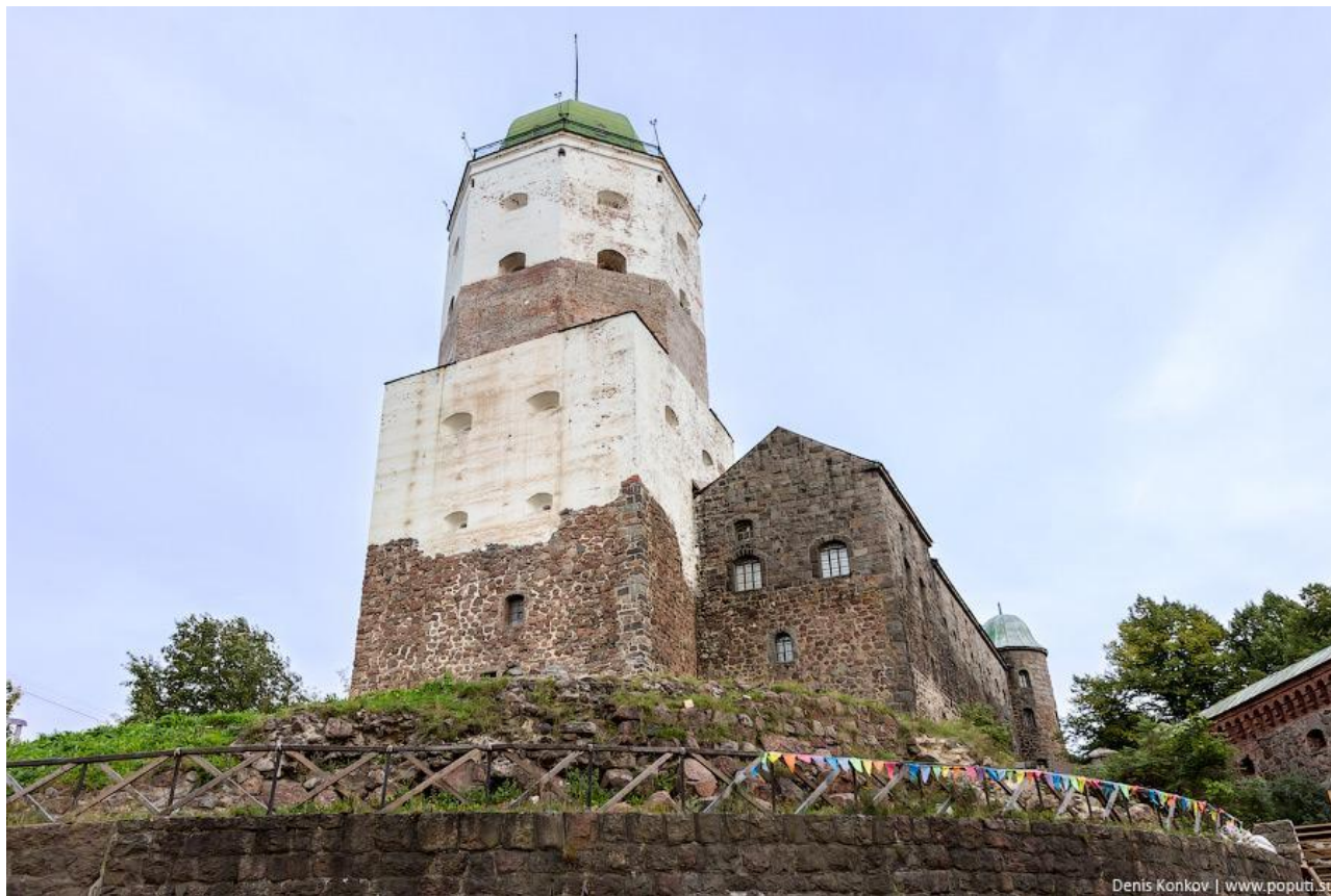
Донжон Выборгского замка

Внутреннее устройство замков отличалось многообразием. За главными воротами мог располагаться маленький прямоугольный дворик с бойницами в стенах — своеобразная “ловушка” для нападающих. Непременным атрибутом замка был большой двор (хозяйственные постройки, колодец, помещения для челяди) и центральная башня, она же “донжон” (donjon).