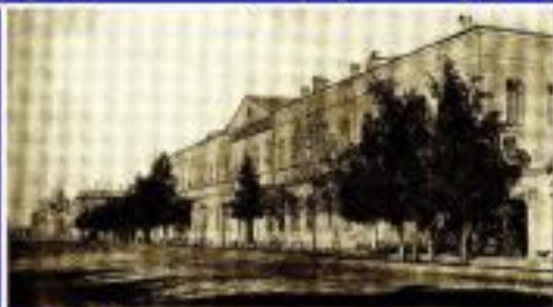
Иркутская мужская гимназия

Иркутская мужская гимназия была открыта 12 ноября 1805 г. Это была первая гимназия в Сибири