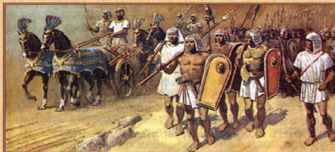
Войско фараона в походе