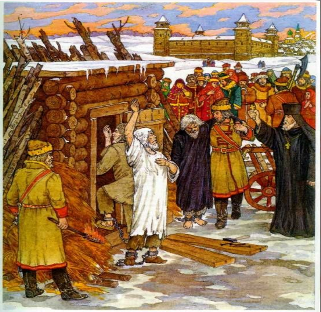
Сожжение вождей староверов