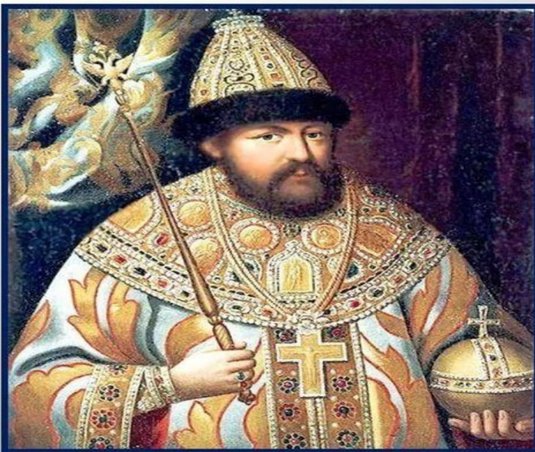
Алексей Михайлович Романов