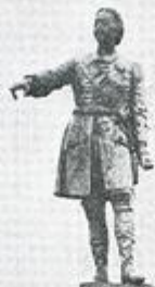
Петрозаводскъ, Олонецкой губ. памятникъ ПЕТРУ ВЕЛИКОМУ основателю города.