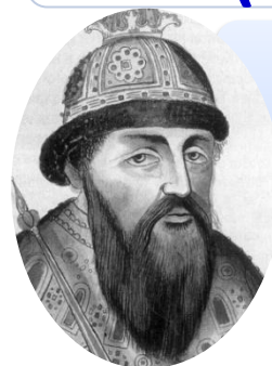
Василий III (1505 – 1533)