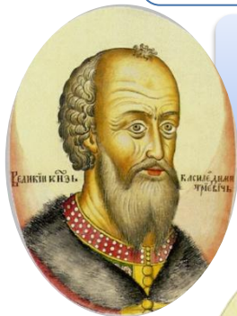
Василий I Дмитриевич (1389 - 1425)