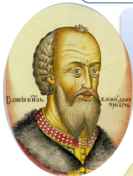
Василий I Дмитриевич (1389 - 1425)