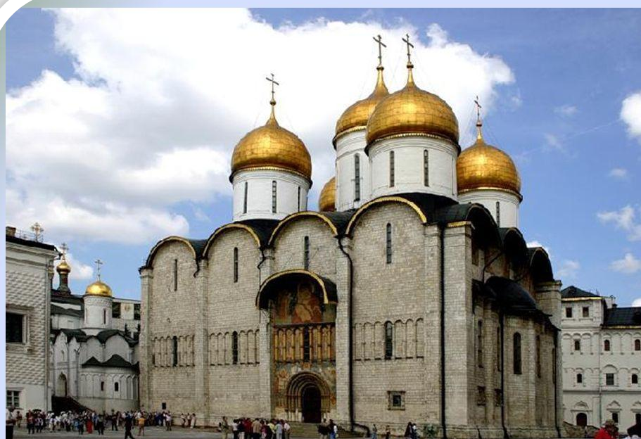
Успенский собор в Московском Кремле

Василий III унаследовал от отца не только любовь к волевым заморским женщинам, но и любовь ко всему итальянскому. Нанятые Василием Третьим итальянские зодчие строили в России церкви и монастыри, кремли и колокольни. Охрана Василия Ивановича состояла также сплошь из иностранцев, и итальянцев в том числе. Они жили в Наливке, «немецком» поселении в районе