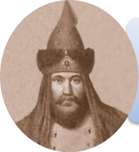
Дмитрий Донской (1359-1389)