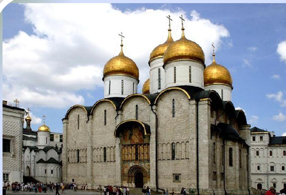
Успенский собор в Московском Кремле

Василий III унаследовал от отца не только любовь к волевым заморским женщинам, но и любовь ко всему итальянскому. Нанятые Василием Третьим итальянские зодчие строили в России церкви и монастыри, кремли и колокольни. Охрана Василия Ивановича состояла также сплошь из иностранцев, и итальянцев в том числе. Они жили в Наливке, «немецком» поселении в районе