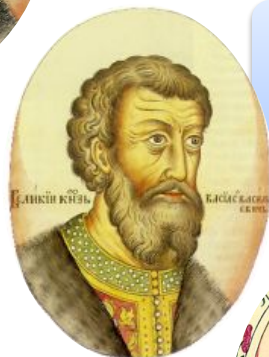
Василий II Тёмный (1425 – 1462)