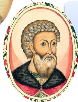
Иван III Великий (1462 – 1505)