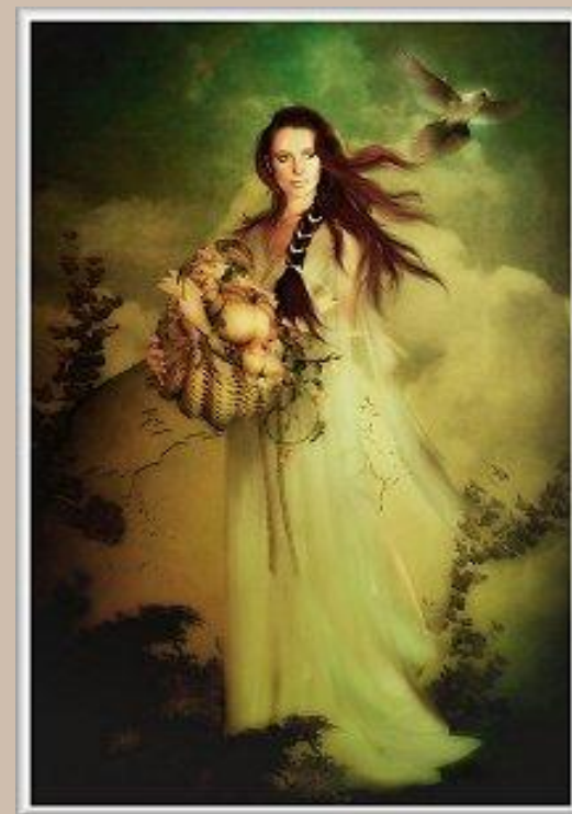
Деметра – богиня плодородия