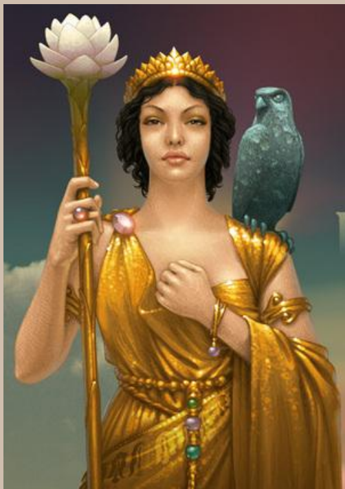
Гера – покровительница брака