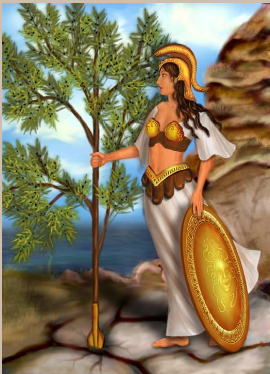
Афина – богиня войны и мудрости