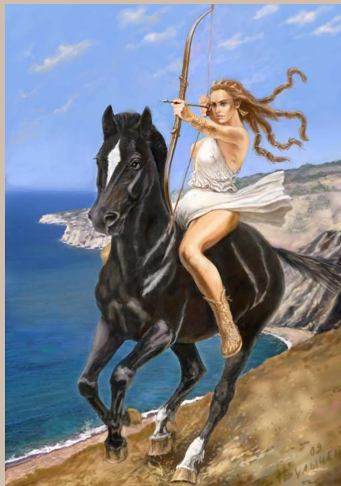
Артемида – богиня охоты, плодородия, женского целомудрия