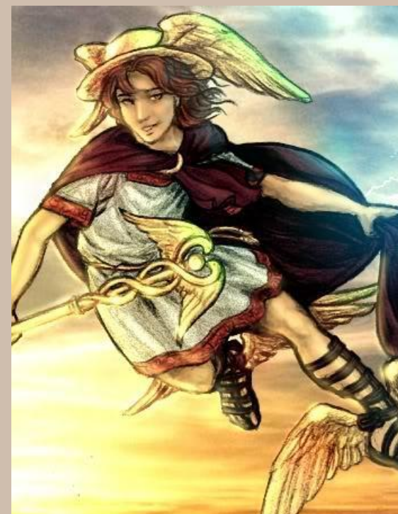
Гермес – бог торговли, прибыли, ловкости