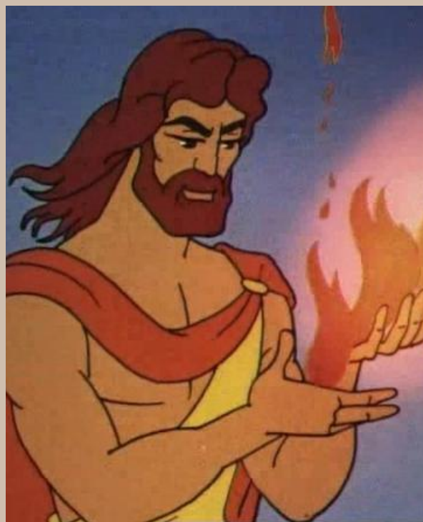
Гефест – бог огня, покровитель кузнечного дела