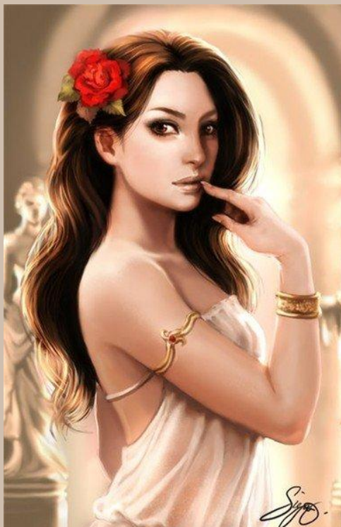
Афродита -богиня красоты и любви