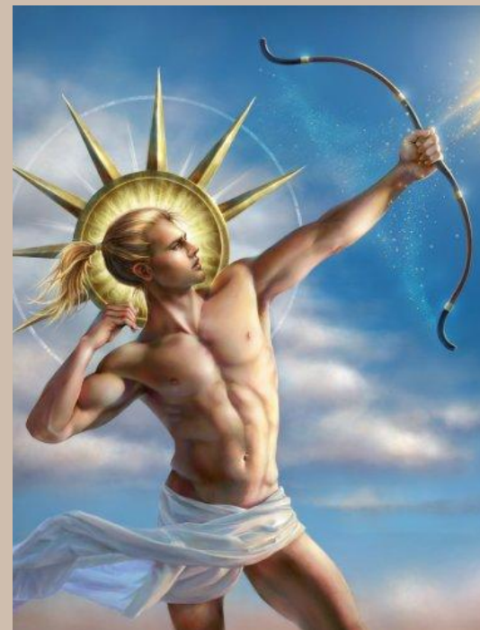
Аполлон – бог солнца и света