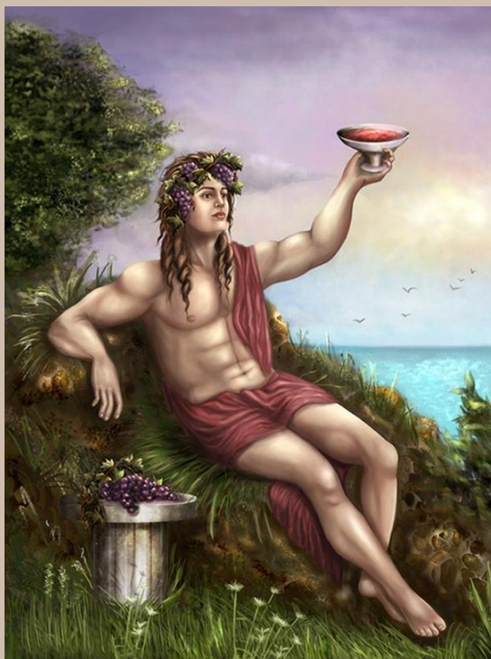
Дионис – бог виноградарства и виноделия