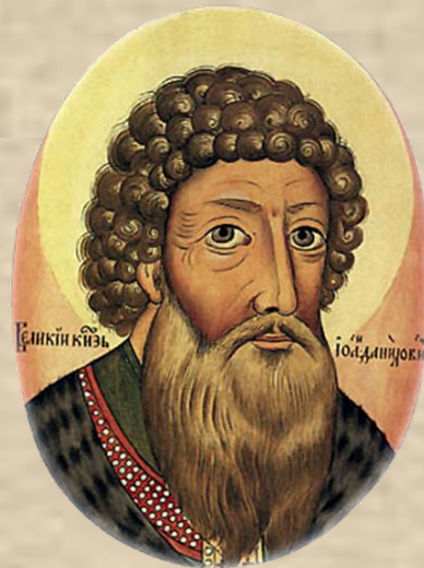
Иван I Калита