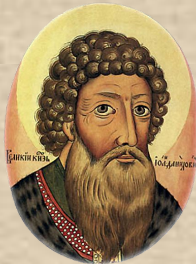
Иван I Калита