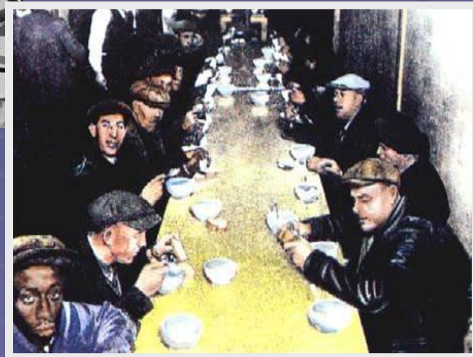
Очередь на бесплатный суп.