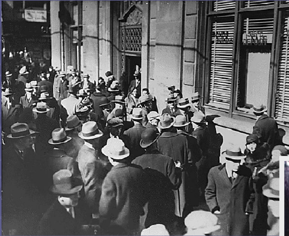
Обманутые акционеры у Банка Америки