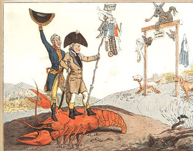
Триумфальное прибытие в Париж Наполеона. Карикатура Венецианова.

оставив глубокий след почти во всех сферах русской жизни начала XIX столетия, оказала благотворное влияние и на развитие русского искусства. Бесспорным считается тот факт, что эта война пробудила любовь к родине, к народу, ко всему родному. Если до двенадцатого года, по удачному выражению историка, все русские хотели казаться французами, то после Отечественной войны они так же сильно хотели быть русскими. Вот это-то желание стать русскими проявилось и у наших художников той эпохи.