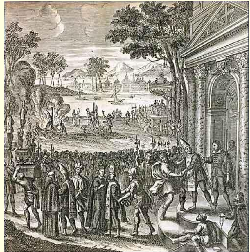
Gravura de auto-de-fé ocorrido em 1688