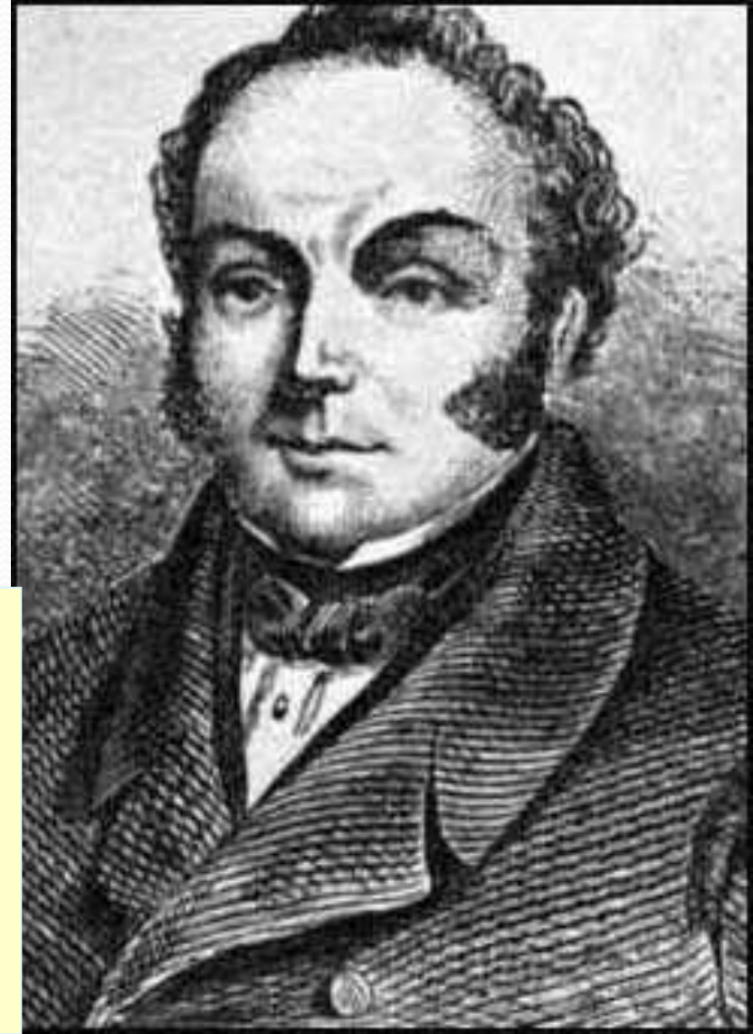
Фергюс О'Коннор (1796-1855), лидер чартистов