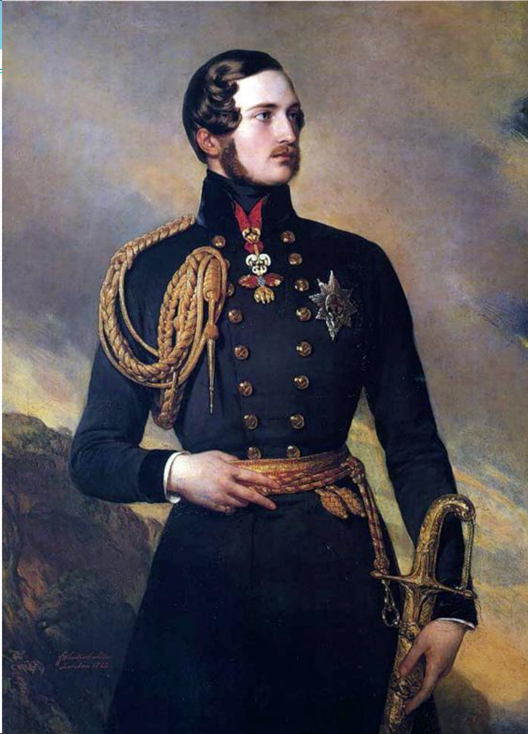
Франц Винтельхалтер. Портрет принца Альберта, 1842