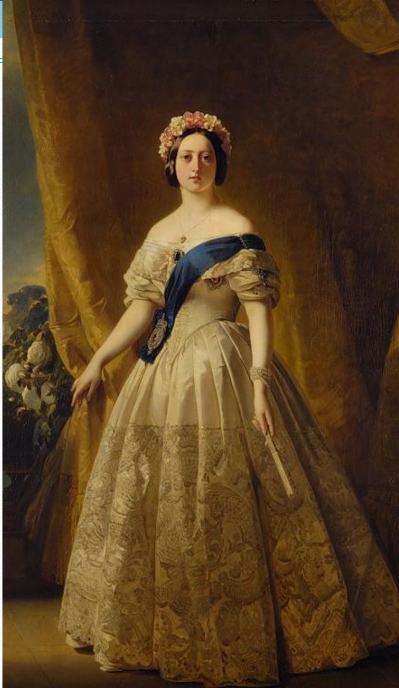
Франц Винтельхалтер. Портрет Королевы Виктории