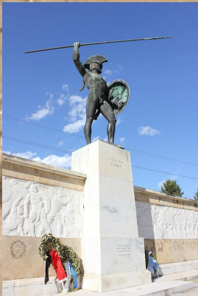
Памятник подвигу 300 спартанцев Греция