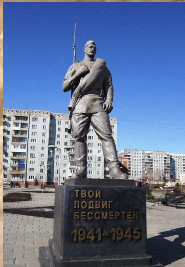
Памятник неизвестному солдату. г. Новокузнецк