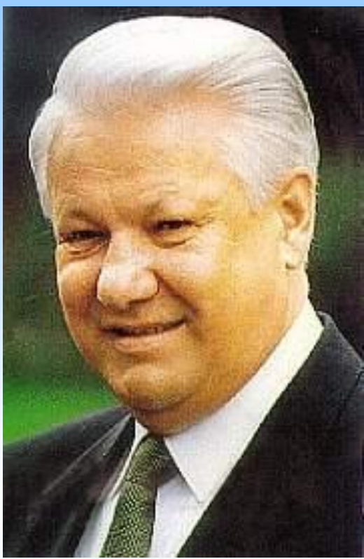
Б. Н. Ельцин