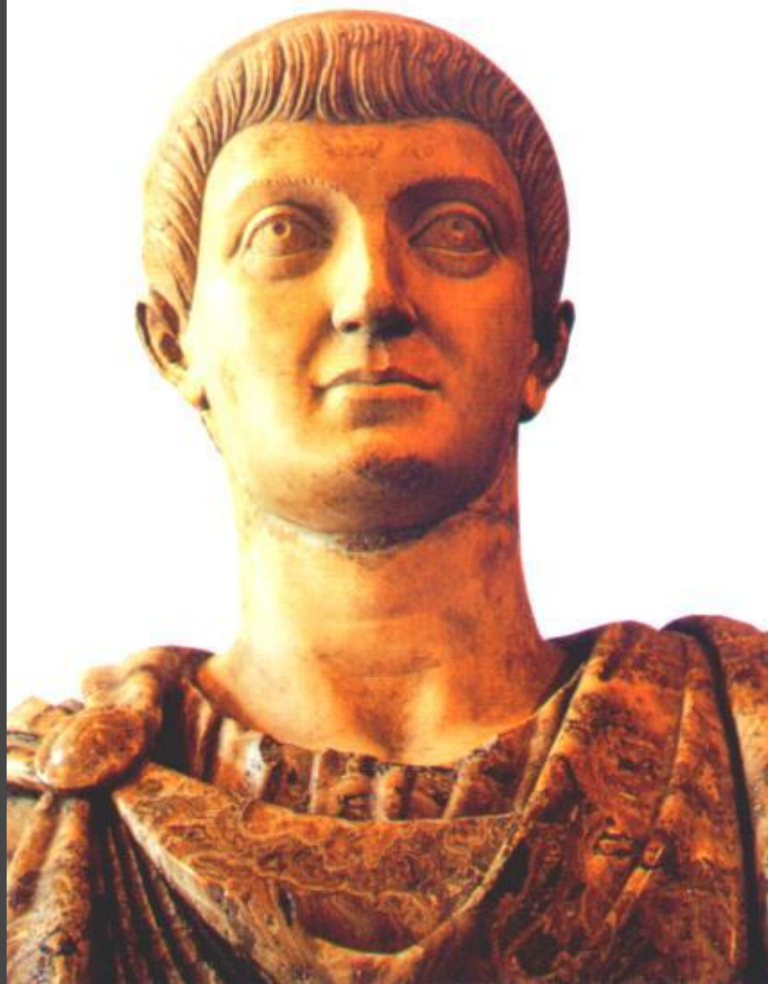
Император Константин Великий.

В начале 4 в. за императорский титул боролись несколько полководцев.