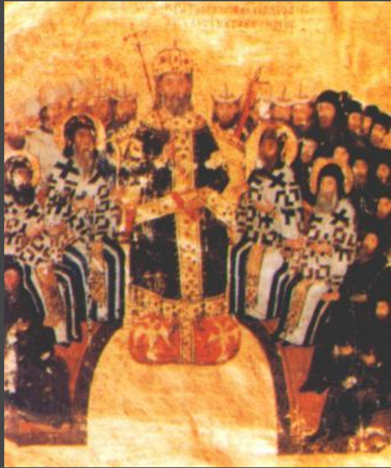
Вселенский собор в Ницце 325 г. Фреска.

При Константине количество христиан возросло.