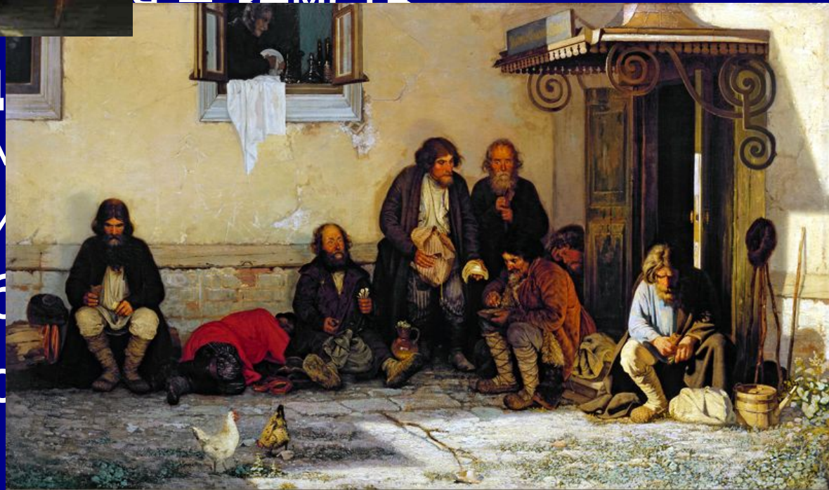
Григорий Михайлов, «Земство обирает»