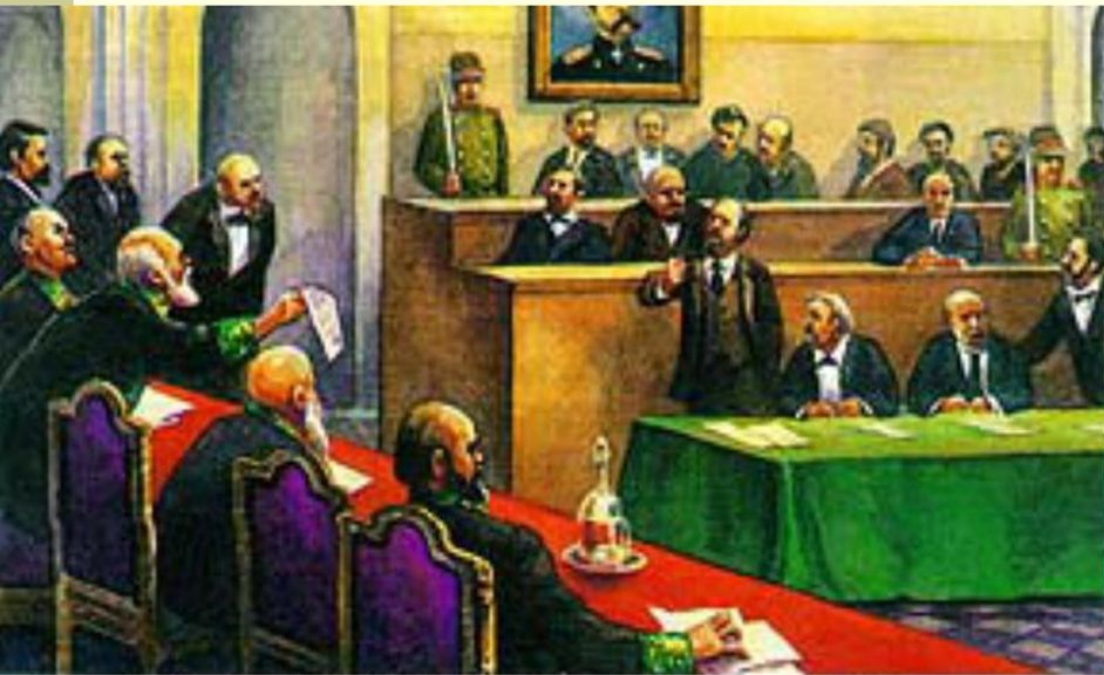
Суд присяжных при Александре II

роданный России в т, проживающий в нее 2 лет.