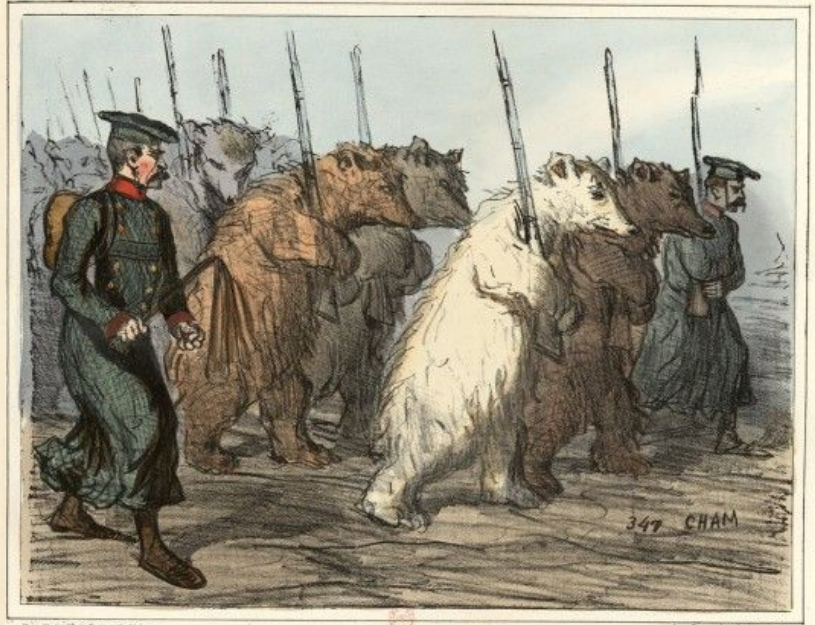
L'armée de réserve de l'empereur de Russie.

Enrôlés volontaires rejoignant leurs régiments.