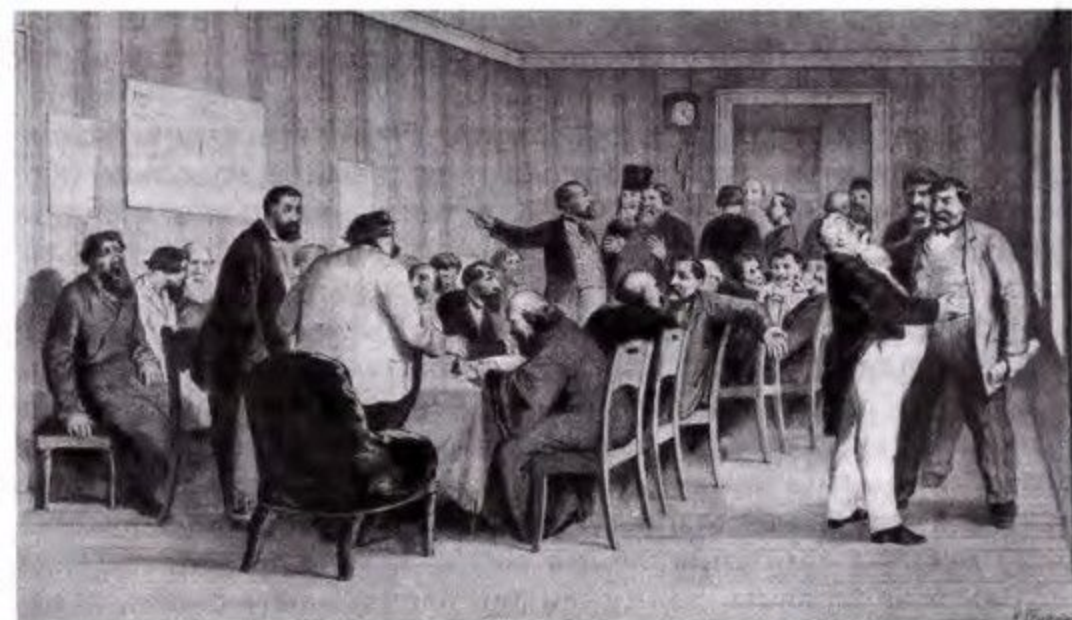
Заседание земства. С картины художника К. Трутовского

м самоуправления ее активную часть «неских мечтаний», я конкретными