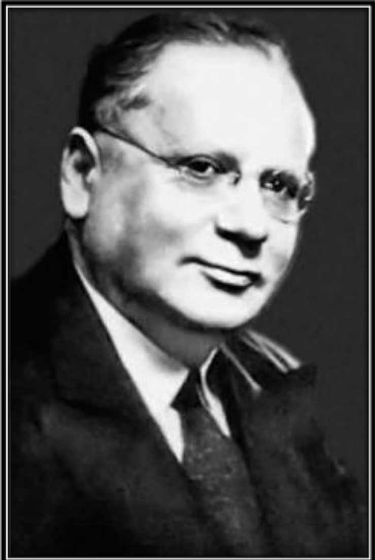
М.М. Литвинов Нарком иностранных дел

советской дипломатии во многом был связан с деятельностью наркома иностранных дел М.М. Литвинова