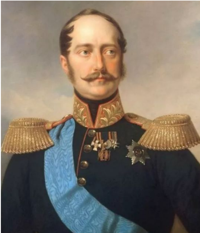
Николай I (1825 - 1855)

Задание: прочитайте п. I. Дайте характеристику новому императору.