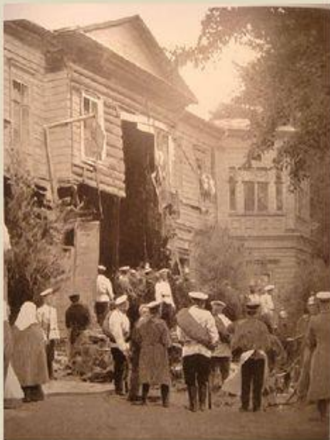
Дача Столыпина на Аптекарском острове после взрыва

Закон о военно-полевых судах был издан в условиях революционного террора в Российской империи. В течение 1901—1907 годов были осуществлены десятки тысяч террористических актов. Среди них были как высшие должностные лица государства. Покушение было совершено и на самого Столыпина - 12 августа 1906 г. пострадали и двое детей Столыпина — Наталья (14 лет) и Аркадий (3 года).