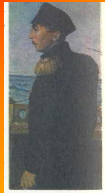
Командовал русской эскадрой в Синопском сражении адмирал П.С. Нахимов