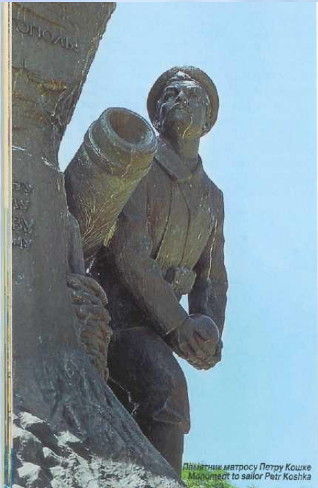
Действительный матросу Петру Кошке Monument to sailor Petr Koshka