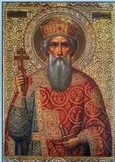
Князь Владимир (Красное Солнышко)