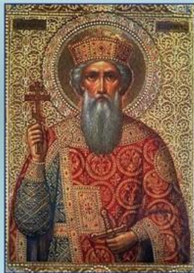
Князь Владимир (Красное Солнышко)