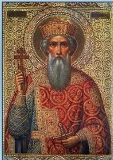
Князь Владимир (Красное Солнышко)