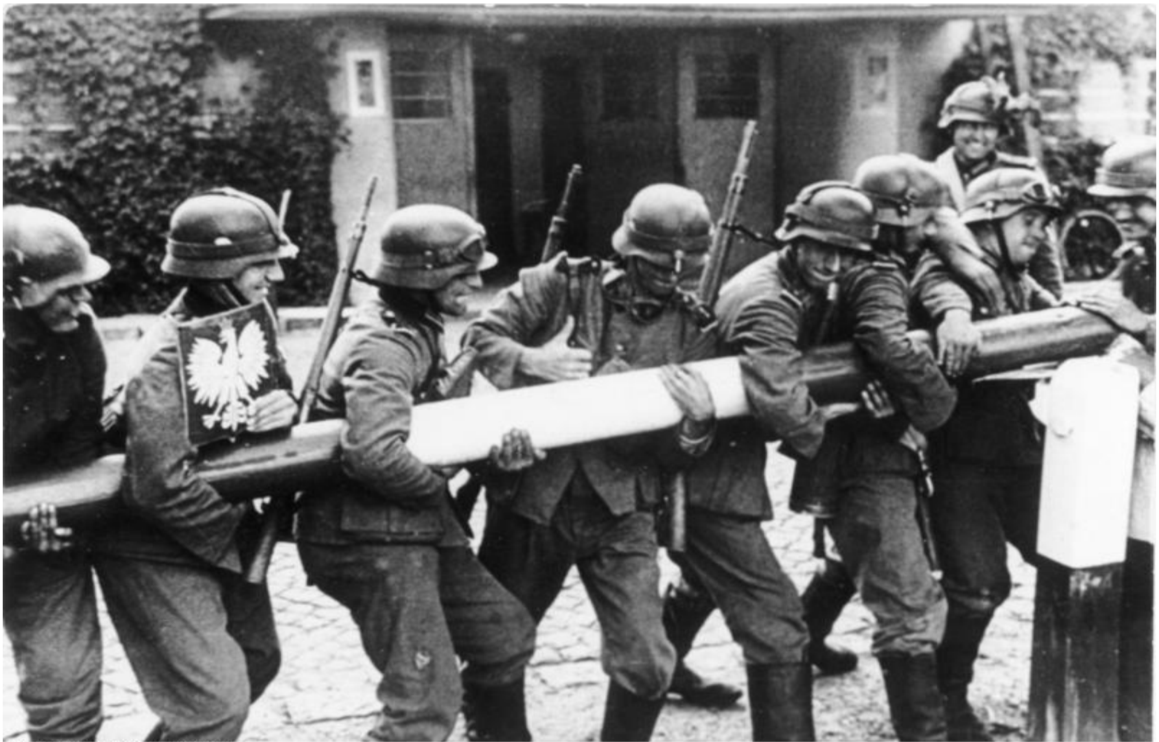
1. September 1939