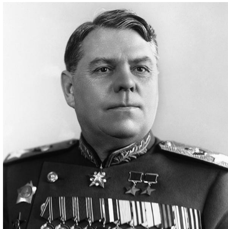
Василевский Александр Михайлович