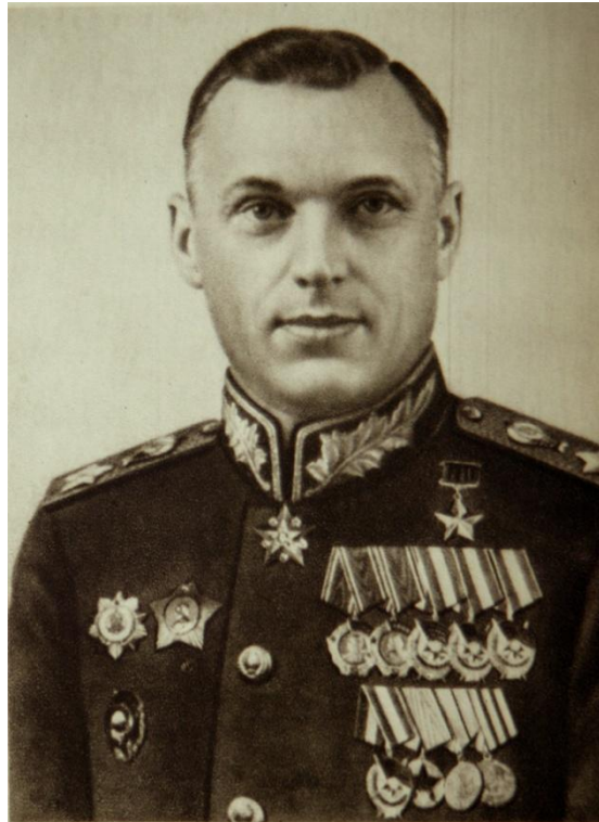
Рокоссовский Константин Константинович