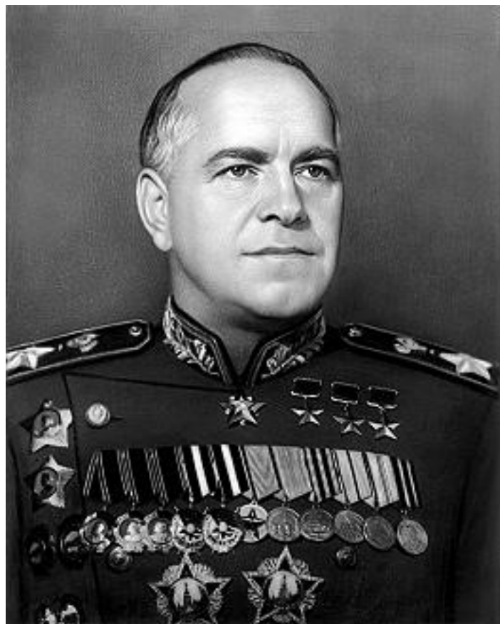
Жуков Георгий Константинович