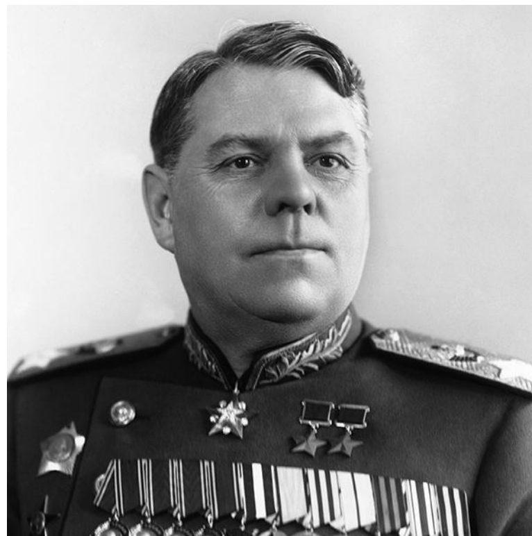
Василевский Александр Михайлович