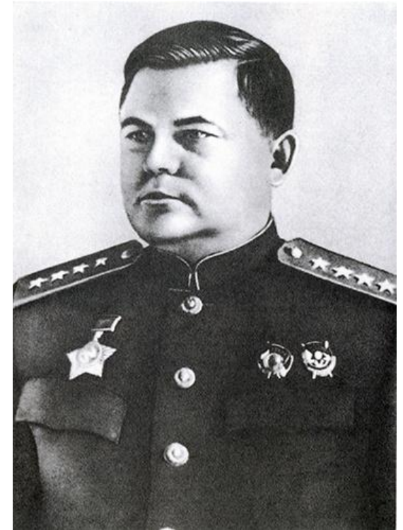
Ватутин Николай Федорович