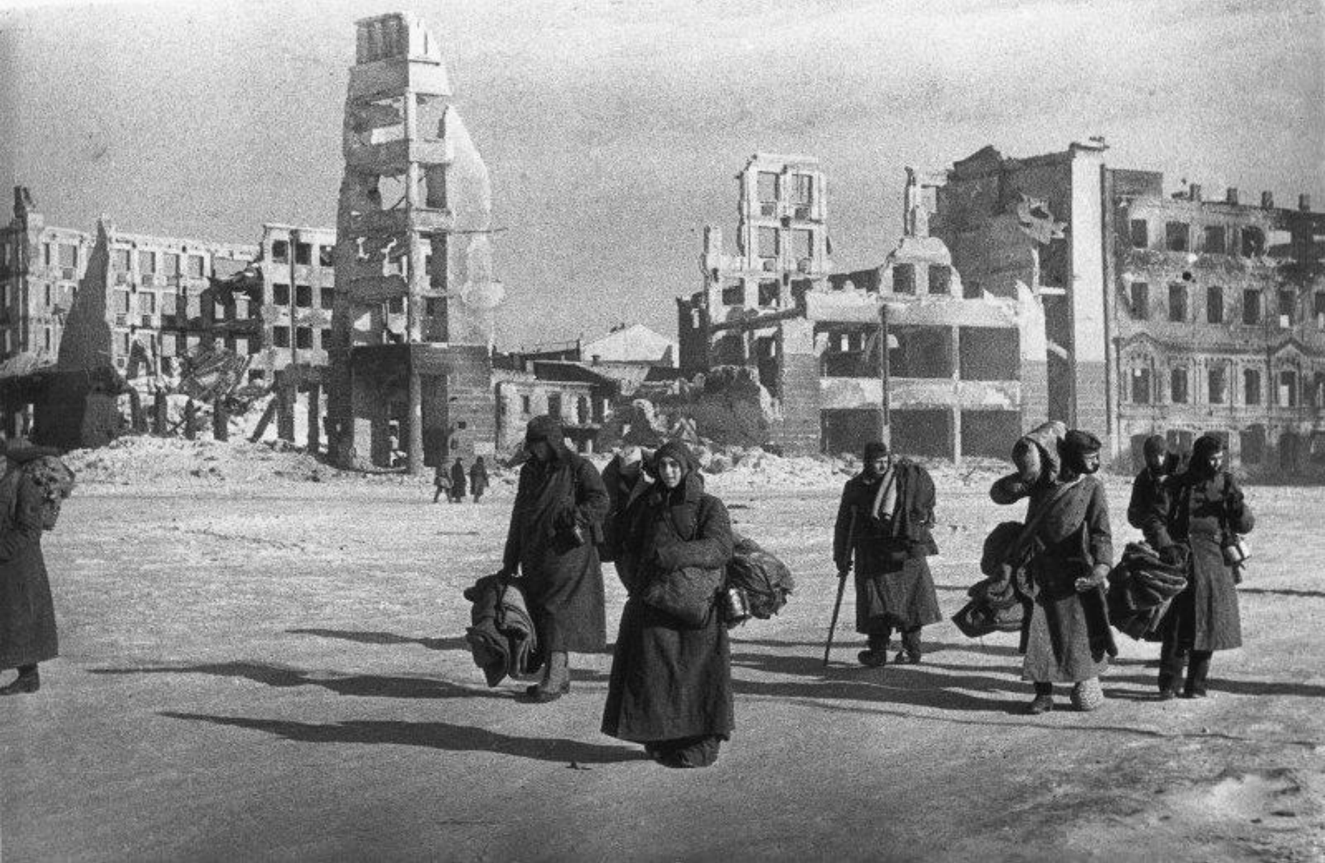
«Покорители мира... в Сталинграде»