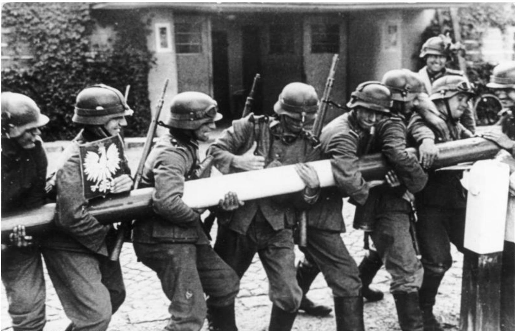
1. September 1939