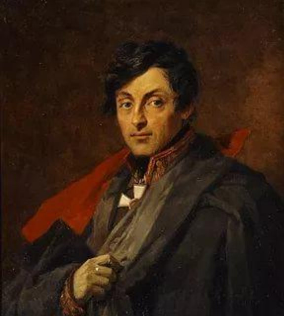
Остерман - Толстой