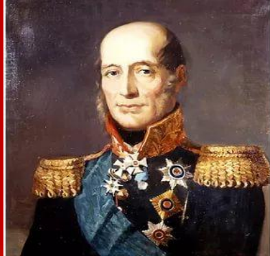
Барклай Де Толли