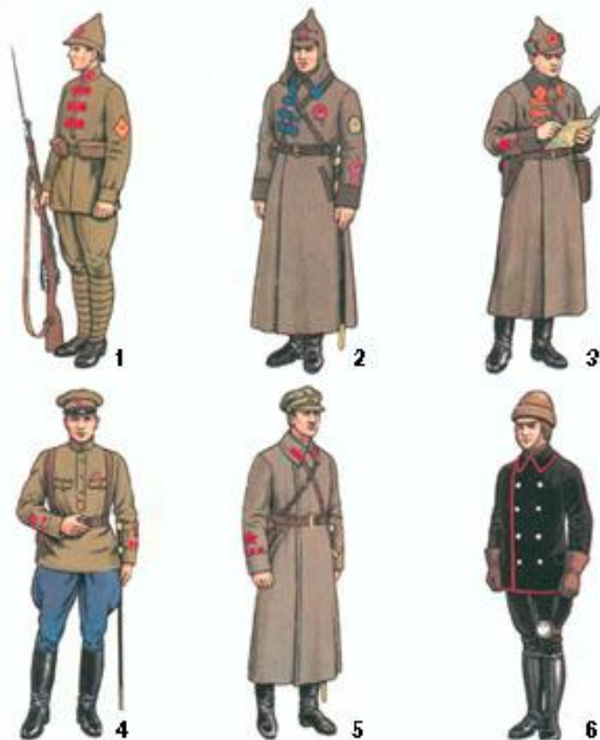
Форма одежды военнослужащих Красной Армии (1919-1922)