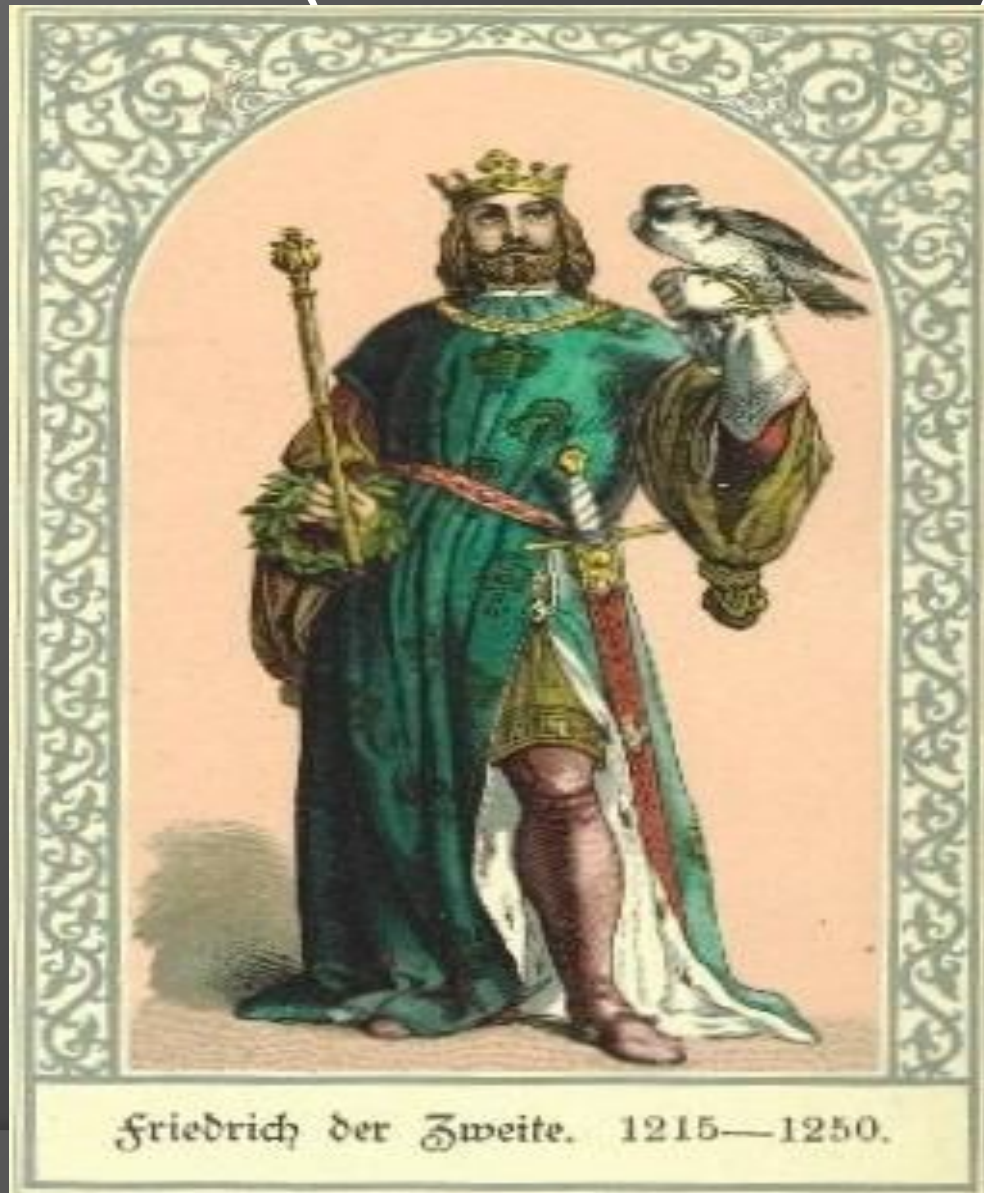
Friedrich der Zweite. 1215—1250.