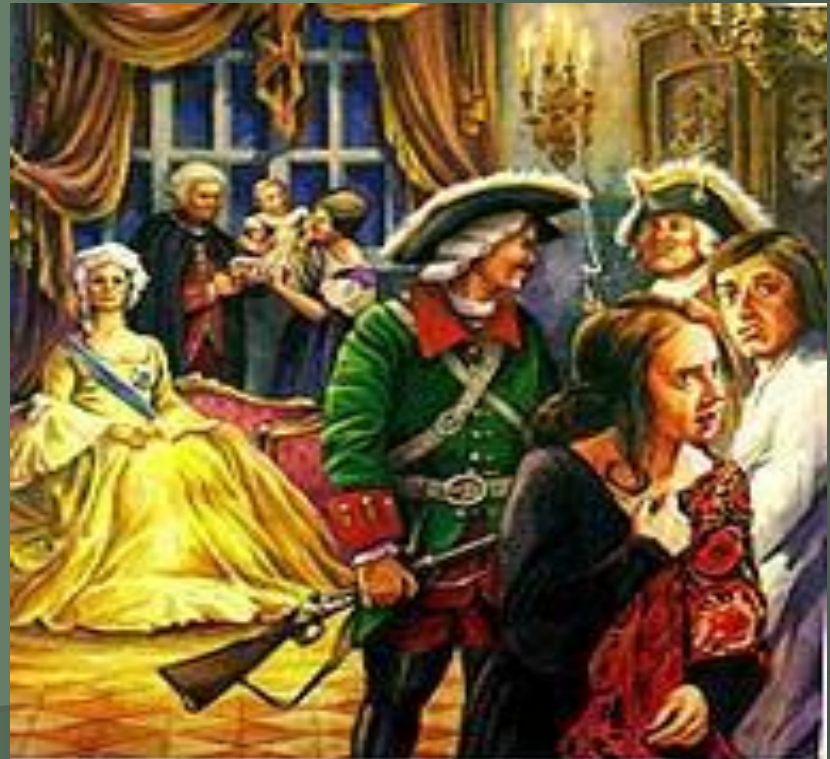
Арест Анны Леопольдовны