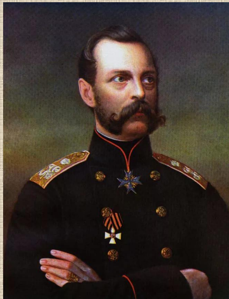
Александр II (1855-1881)