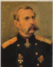
Император (1855–1881) Александр II