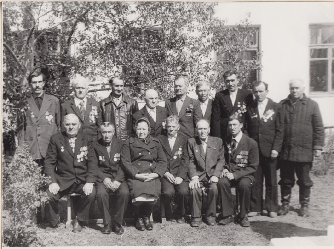
Участники Великой Отечественной войны

Участники Великой Отечественной войны Семья [unreadable]