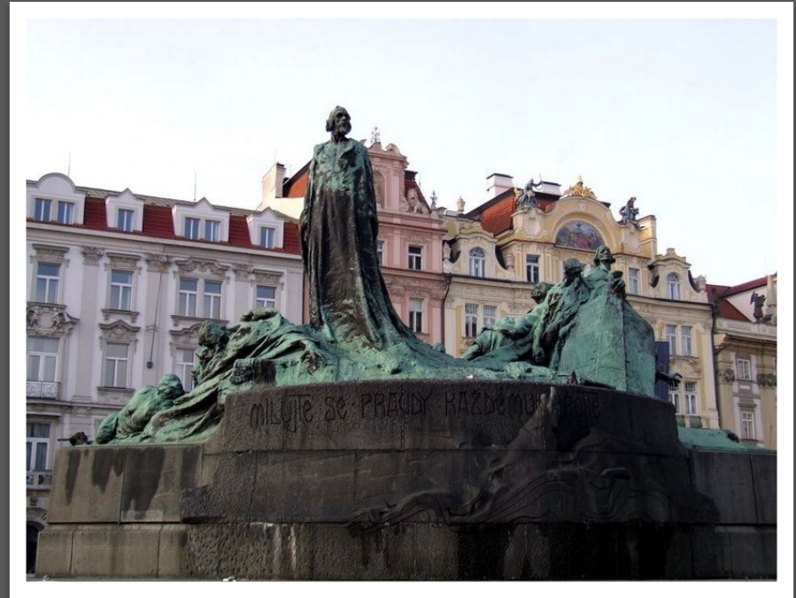
Памятник Яну Гусу в Праге