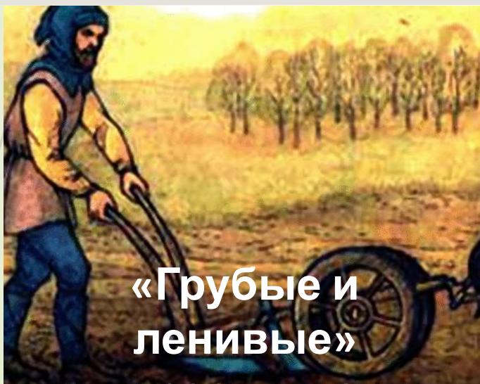
«Грубые и ленивые» крестьяне

Феод – земельное владение, данное за конную военную службу