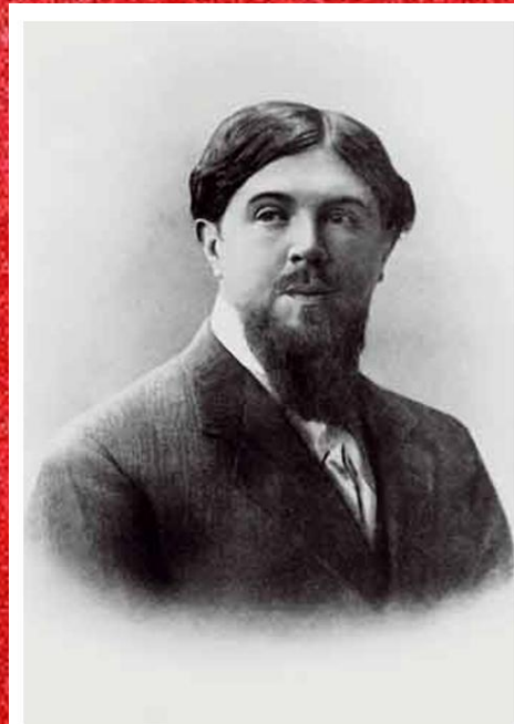
Николай Павлович Рябушинский