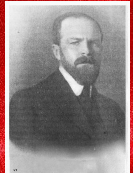
Степан Павлович Рябушинский