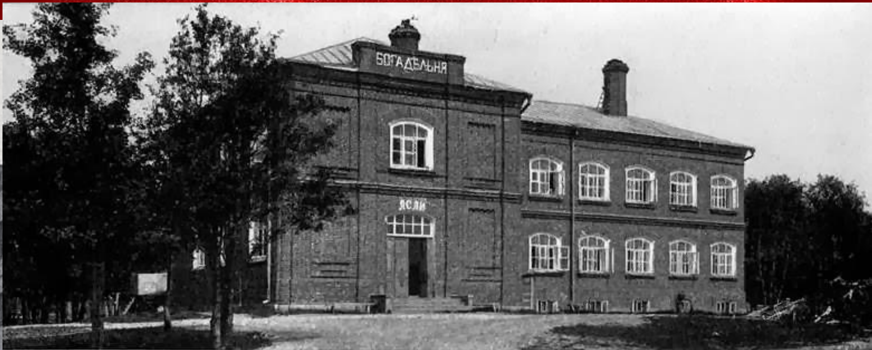
Богадѣльня и ясли.