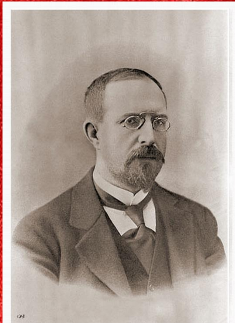
Павел Павлович Рябушинский