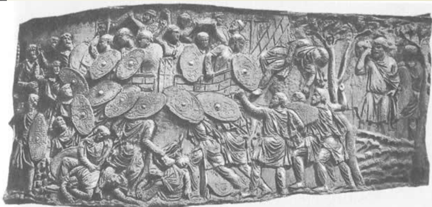
Фрагмент барельефа колонны Траяна: даки штурмуют римское укрепление