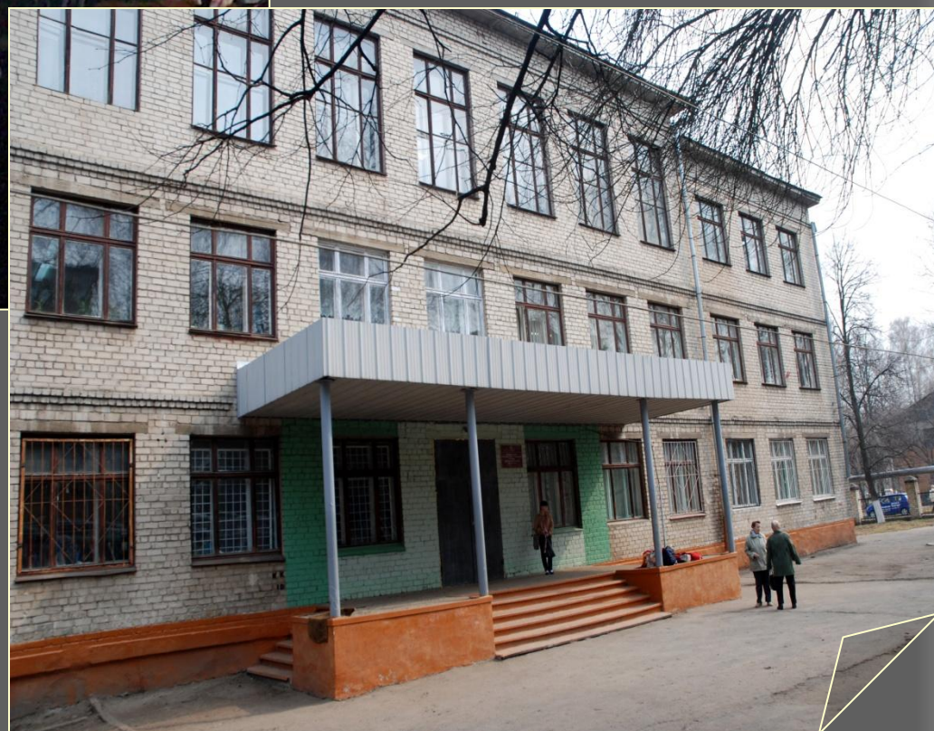
МОУ СОШ №175, Н.Новгород, 2010