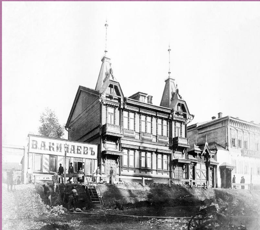
Дом дворянина Ю.И. Поплавского. Фотоснимок 1901 года