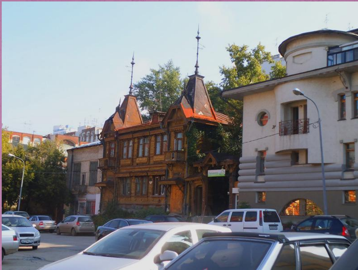
Бывший дом Ю.И. Поплавского, ныне Фрунзе, 171. Памятник культурного наследия регионального значения (Р.ОИ от 06.05.87 г. № 165)