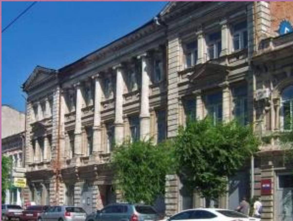
Вид особняка Поплавского с четной стороны улицы Куйбышева (Дворянской)