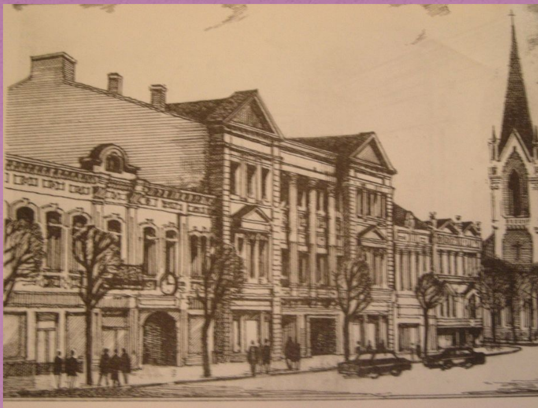
Здание школы №15 советский период