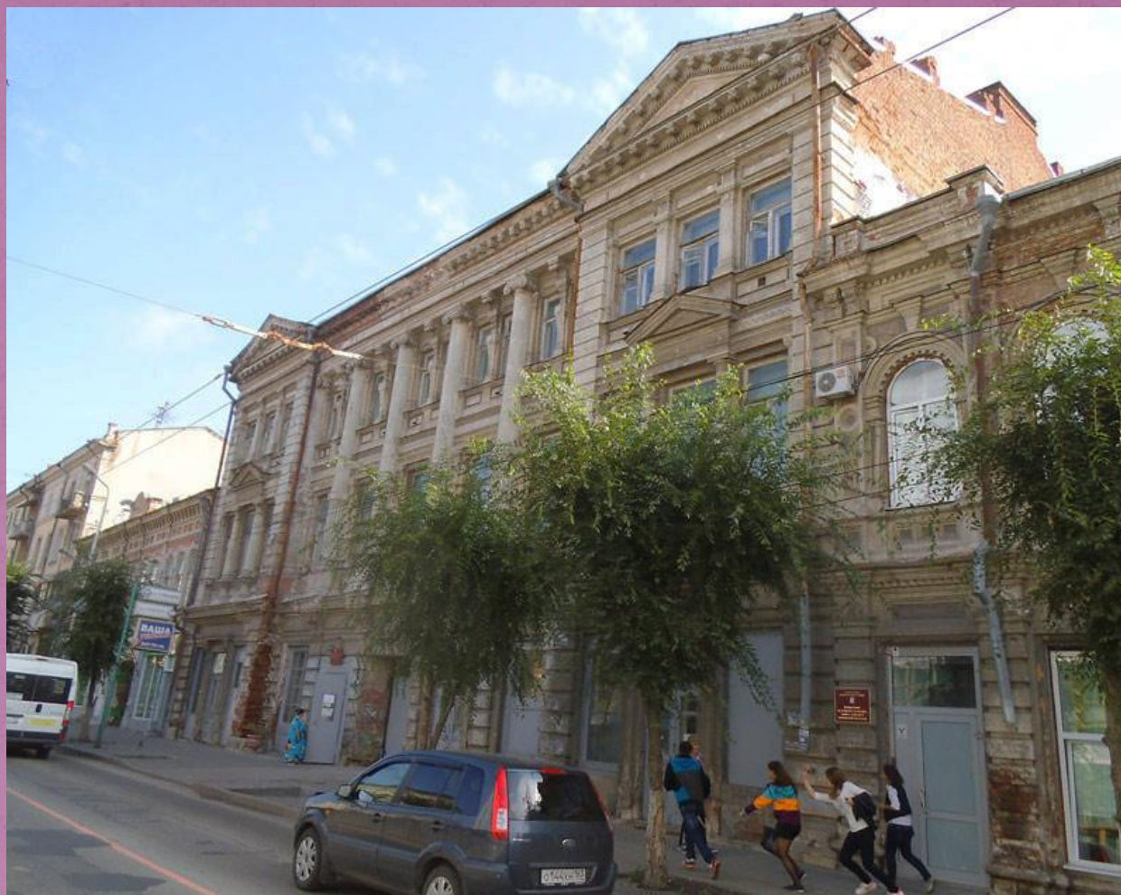
Школа №15 особняк Поплавского в наше время