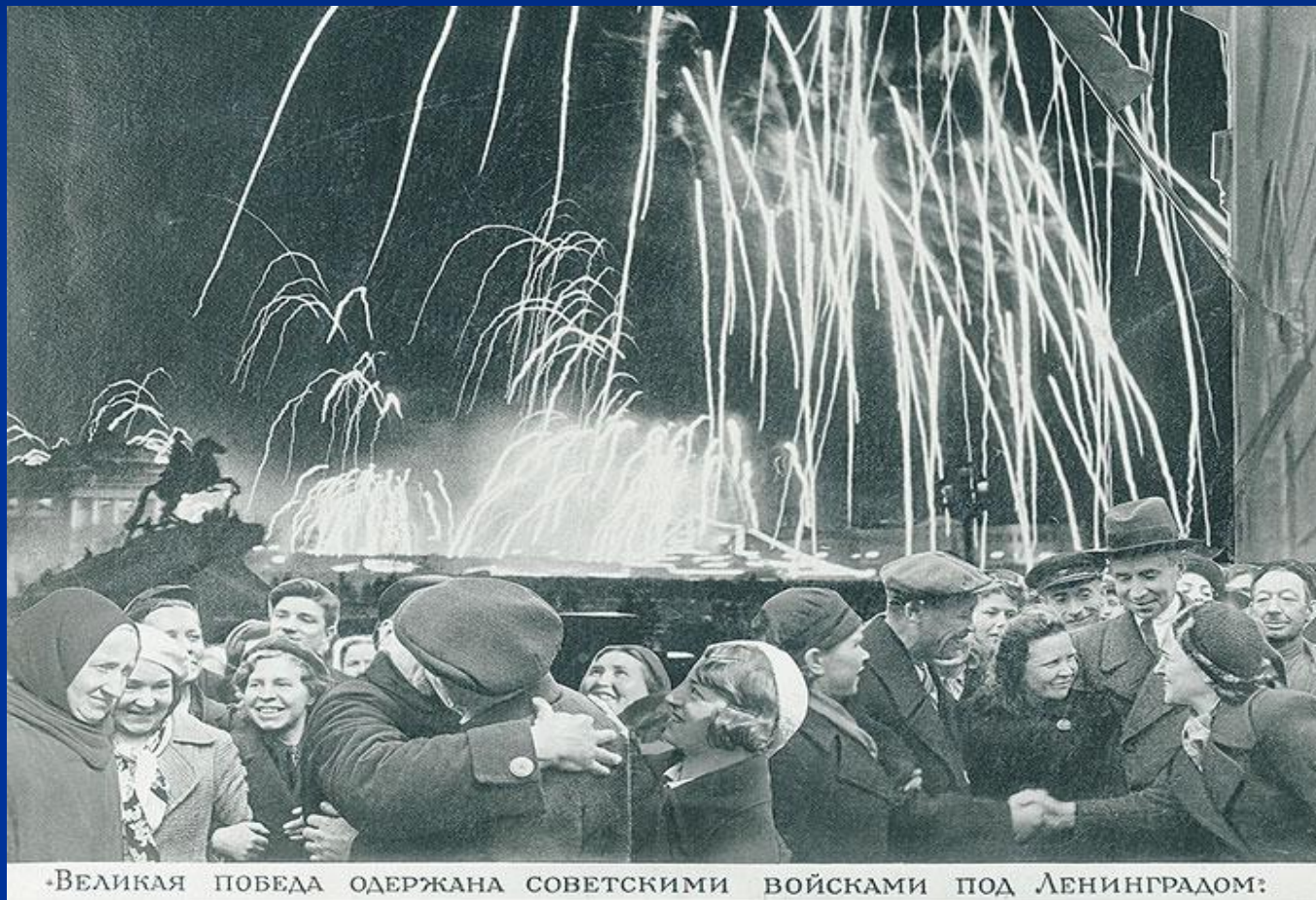
«Великая победа одержана советскими войсками под Ленинградом»

Снятие блокады 14 – 27 января 1944г. в ходе операции советских войск «Январский гром» противник был отброшен на расстояние 60-100 км от Ленинграда. Блокада была полностью снята.