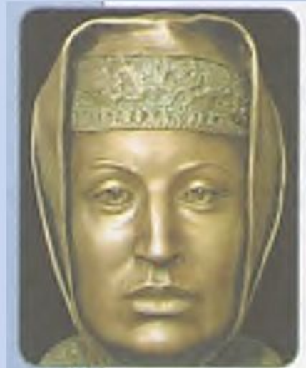
Софья Палеолог. Реконструкция С. А. Никитина