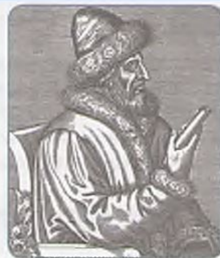
Василий III. Гравюра XVI в.