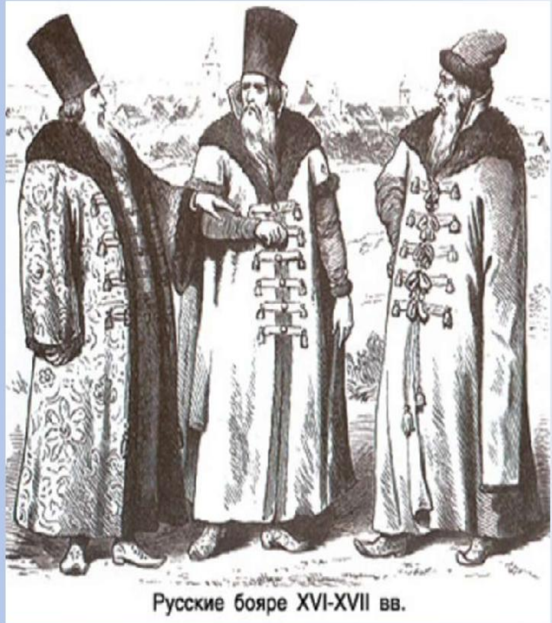
Русские бояре XVI-XVII вв.

Опорой власти являлся государев двор -правлящая верхушка московского общества. В него входили представители старых боярских родов (Морозовы, Шереметовы, Салтыковы). Помимо них, членами государева двора были отпрыски литовской династии Гедиминовичей (Голицины, Трубецкие, Хованские). Из членов государева двора назначались, наместники, воеводы, послы.