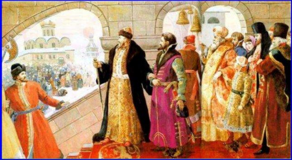
Великий князь и его окружение

Власть великого князя не была неограниченной. Существовала Боярская дума, значительной властью обладали кормленщики (наместники), сложилась система местничества (право каждого феодала занимать то место в системе управления, которое принадлежало ему по праву знатности рода).