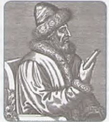
Василий III. Гравюра XVI в.