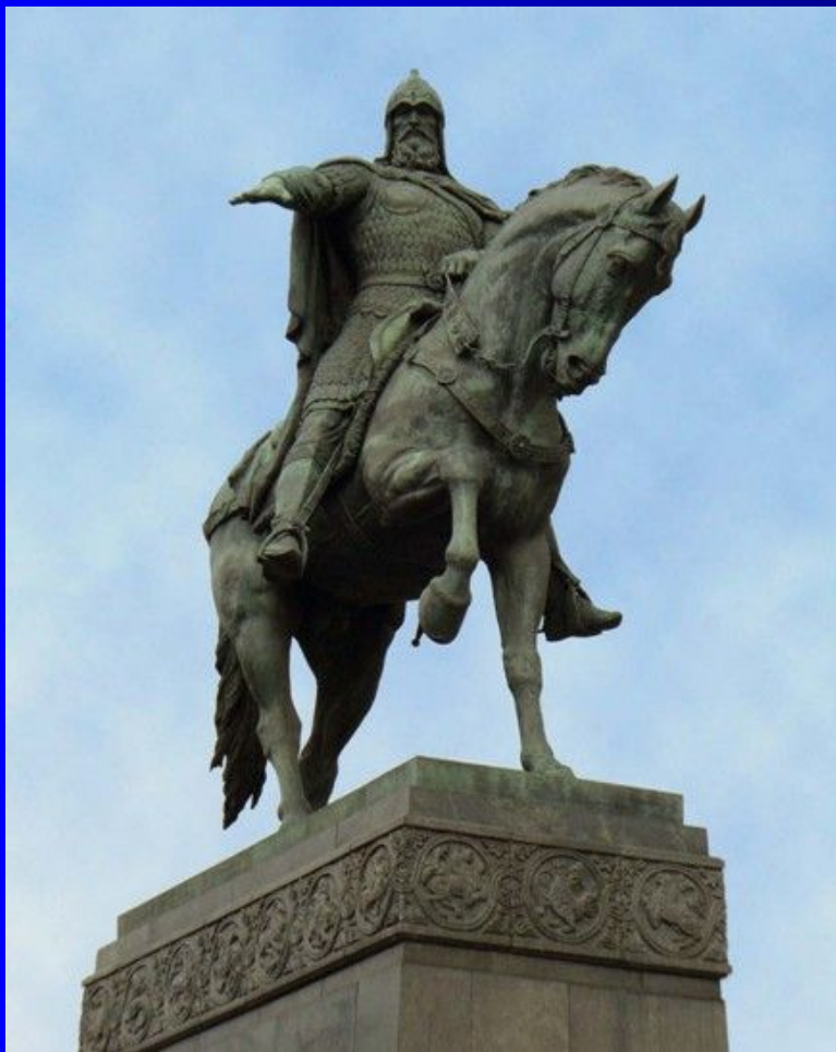
Памятник в Москве