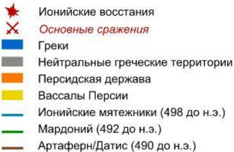
Карта греко-персидских войн (500–479 до н.э.)