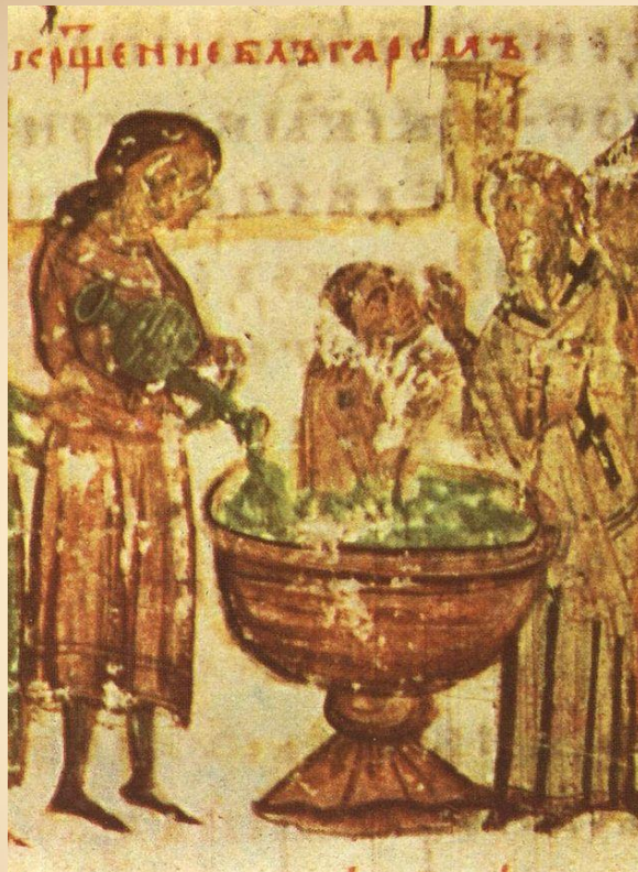
Борис I 852–889 гг.

В 865 г. болгарский царь Борис I принял христианство по православному обряду.