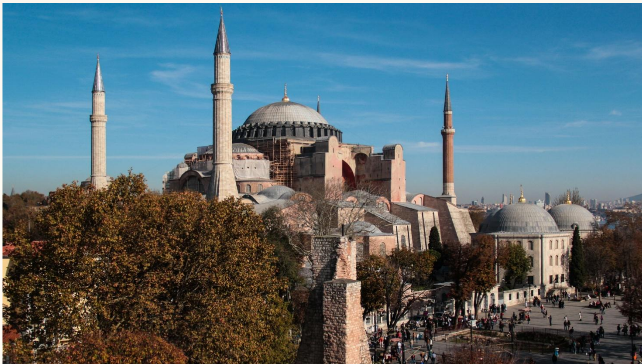
Собор Святой Софии, Константинополь(ныне Стамбул)