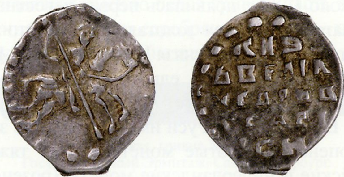
Копейка 1535–1538 гг.