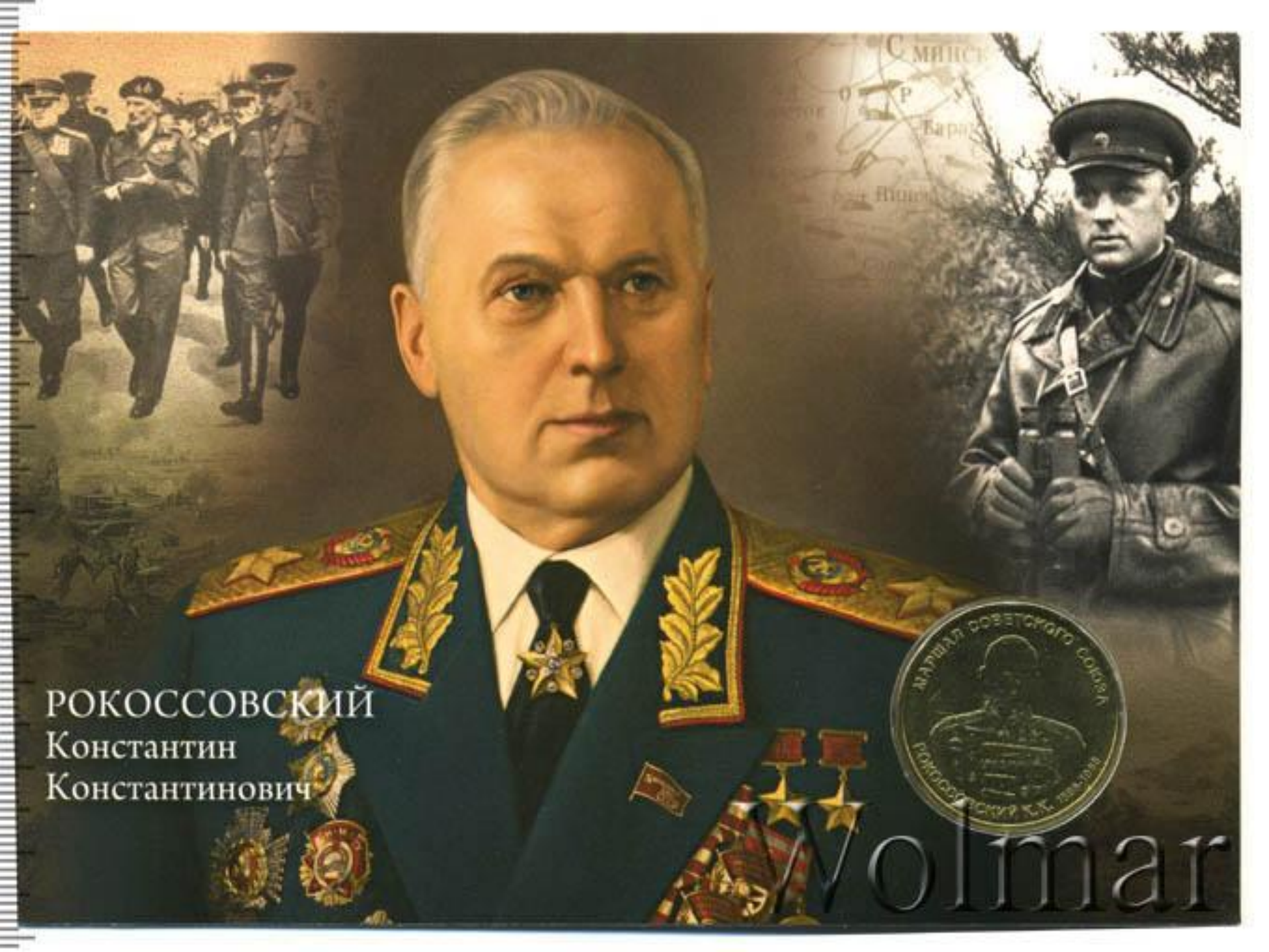
РОКОССОВСКИЙ Константин Константинович