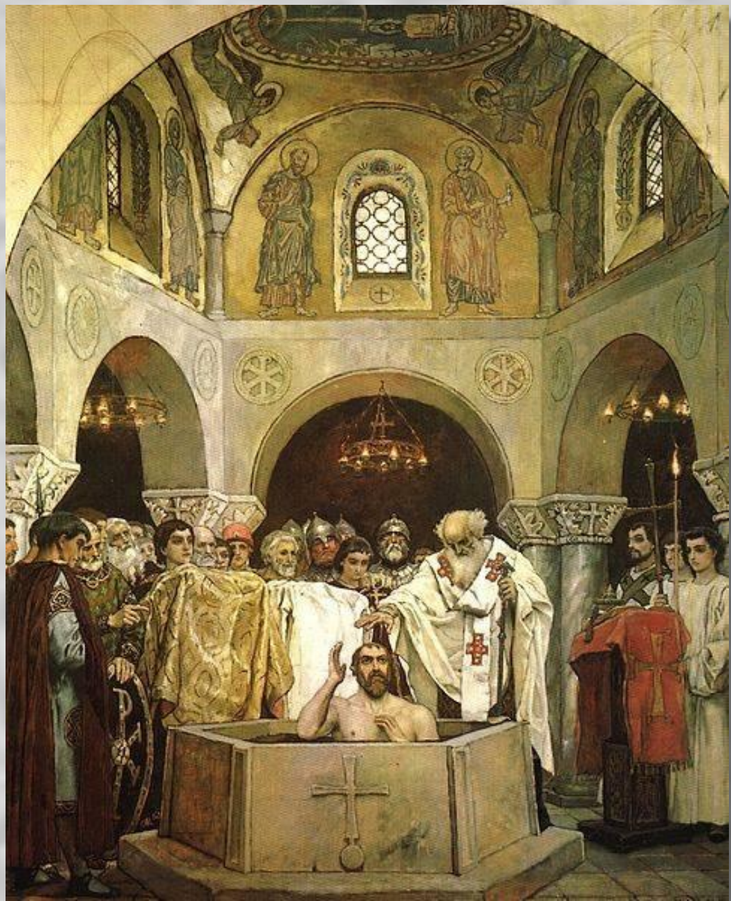
Фреска «Крещение князя Владимира». В. М. Васнецов