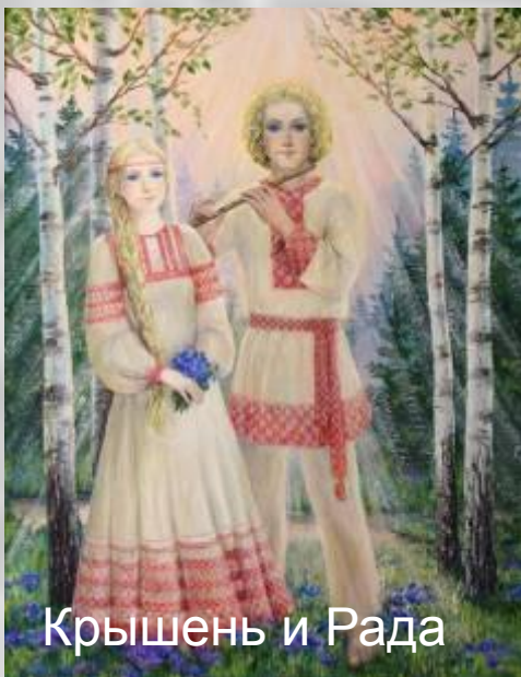
Крышень и Рада