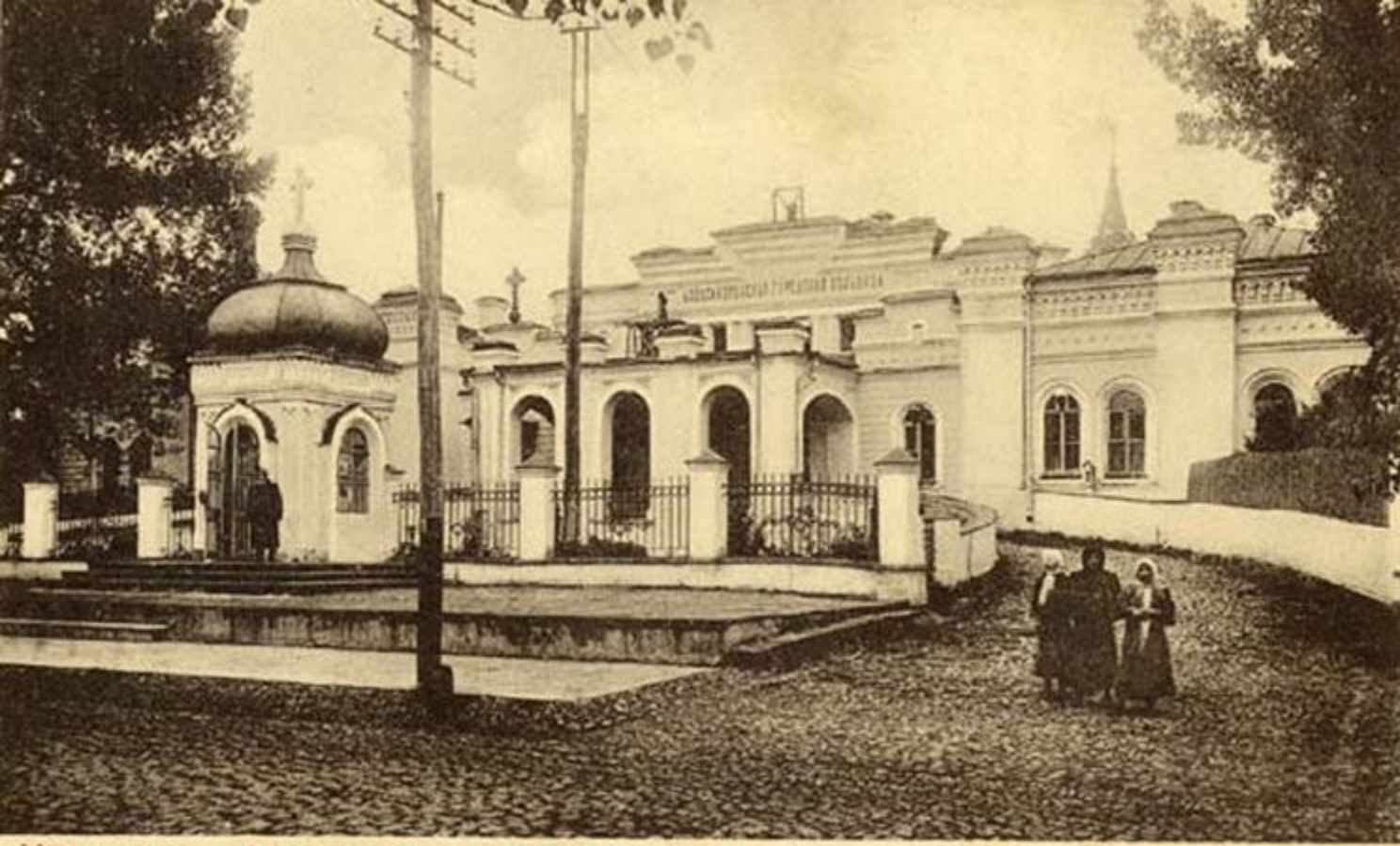
Харьковъ. Александровская больница

.У 1860-х рр. у Харкові з'явилися лікарня медичного товариства й Олександрівська лікарня