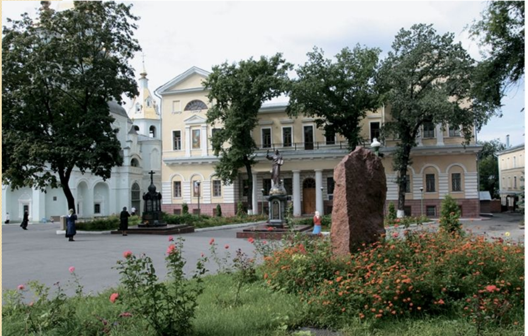
Архієрейський будинок друга половина 18 ст. в стилі класицизма