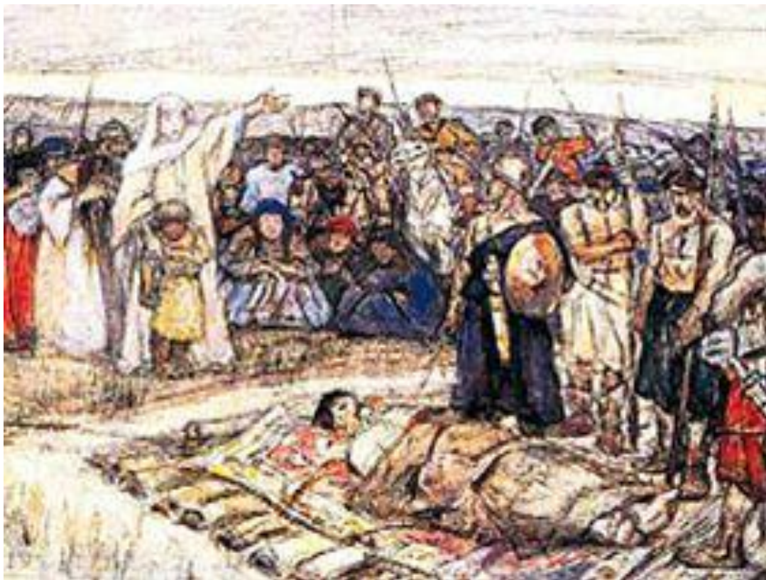
Василий Суриков. «Княгиня Ольга встречает тело князя Игоря». 1915 г