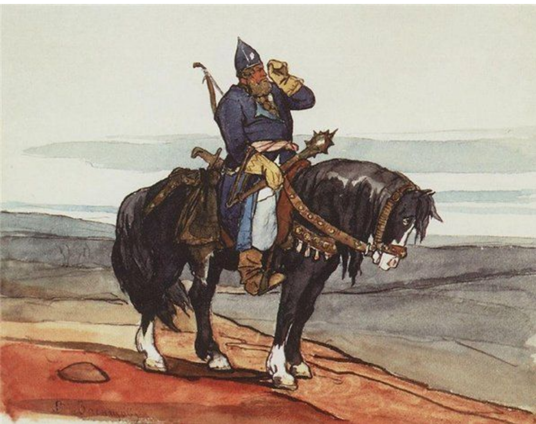
В.Васнецов .Витязь на коне .Илья Муромец.