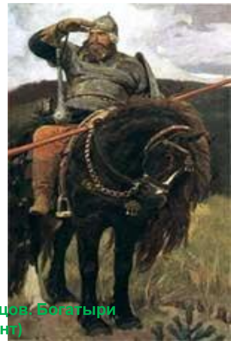
В.Васнецов. Богатыри (фрагмент)