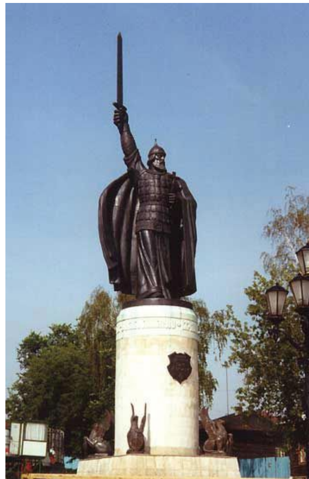
В.М.Клыков.Памятник И.Муромцу в Муроме