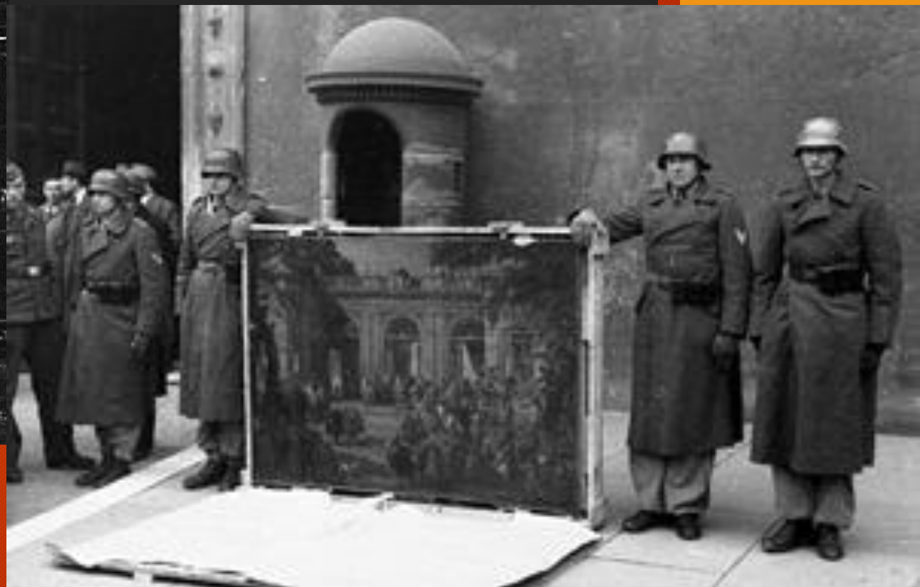
Солдаты дивизии «Герман Геринг» с одним из трофеев в 1944 году