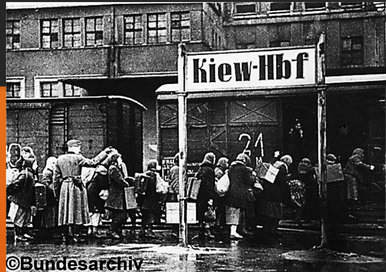
Насильственный вывоз советских граждан в нацистскую Германию ( 5,2 млн человек )